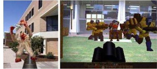
FIG. 11: Le jeu ARQuake [42]

la réalité augmentée en extérieur. Ce dernier est une adaptation du célèbre jeu Quake apparu en 1996. Le but du projet est de construire un jeu qui se déroule dans un environnement réel dans lequel le joueur peut se mouvoir librement. À partir de la position de sa tête et de l'orientation de son regard, les objets virtuels (des monstres par exemple) sont alignés sur son point de vue à travers un casque de visualisation semi-transparent. La pose est obtenue en combinant les données du capteur inertielle avec le résultat du suivi visuel basé sur la librairie ARToolkit. Une base de données contenant les modèles 3D de tous les bâtiments est créée afin de permettre l'évolution des joueurs dans l'espace de jeu. Depuis, d'autres jeux interactifs utilisant la RA ont vu le jour, tel que Game-City [7], Human Pacman [6].