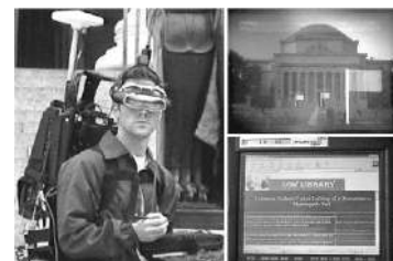
FIG. 7: La plate-forme MARS et son interface de navigation [22]

Lancé en 1996 par le laboratoire "Computer Graphics and User Interfaces Lab - Columbia university", le projet MARS [22], anagramme de "Mobile Augmented Reality System", fut l'un des premiers projets sur la réalité augmentée en extérieur. Son objectif était d'explorer la synergie entre la réalité augmentée et l'informatique mobile. La plate forme développée fournissait des informations sur l'environnement où évoluait l'utilisateur, permettant ainsi de créer ce que les initiateurs du projet appelaient " la machine de guide personnalisée ". Le système est constitué d'un sac à dos contenant l'unité de traitement (un ordinateur portable) et une antenne GPS. Un correcteur différentiel est associé au récepteur GPS afin d'obtenir une position plus précise de l'utilisateur. L'orientation du point de vue est déterminée grâce à un magnétomètre inertielle. L'agent de terrain est équipé d'une tablette PC et muni d'un stylet pour interagir avec le moteur de recherche.