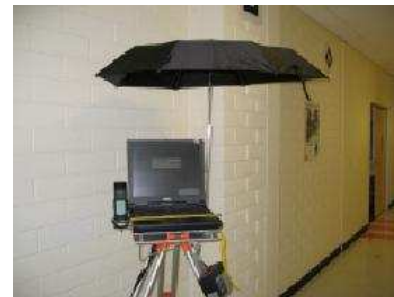
FIG. 12: La plate-forme ARVino [27]

La plate-forme ARVino [27] utilise la RA afin de visualiser des données GIS de viticulture. Le système ARVino est disposé sur un trépied composé d'une table pivotante. Il est constitué d'un ordinateur portable, d'une caméra vidéo, d'un récepteur GPS et d'un détecteur magnétique d'orientation.