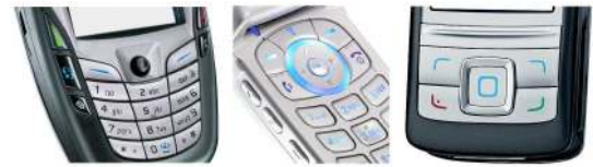
FIG. 3: Les touches ; le dénominateur commun des téléphones portables.

Dans le cas des interactions 3D, l'utilisation du clavier pose un problème dû au signal binaire qu'il fournit. Par exemple, dans le cas de la navigation, il est difficile de fixer la vitesse de déplacement lors de l'appui sur une touche. Néanmoins plusieurs stratégies ont été développées. Par exemple, la sélection d'un point à l'aide de touches