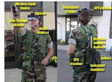
FIG. 6: Le prototype BARS testé par un militaire [23]

Le projet BARS "Battlefield Augmented Reality System" [23] (Na-