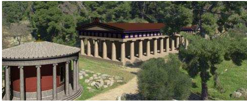
FIG. 9: Reconstruction 3D d'un temple grec fournie par le système ARCHEOGUIDE [14]

Débuté en 2000, le projet " ARCHEOGUIDE : Augmented Reality-based Cultural Héritage On-site GUIDE" [14] vise à concevoir de nouvelles méthodes interactives pour l'accès aux informations sur l'héritage culturel. Ce système est composé essentiellement d'un ordinateur portable, d'un casque HMD, d'écouteurs, d'un microphone et d'une caméra. En fonction de la position du visiteur sur le site, ARCHEOGUIDE filtre les informations n'affichant que celles qui correspondent aux monuments perçus par l'utilisateur. De plus, l'interface développée permet de choisir entre plusieurs thèmes (en différentes langues) et supports multimédia. ARCHEOGUIDE offre surtout la possibilité de visualiser en 3D les parties endommagées des vestiges reconstruits en images de synthèse.