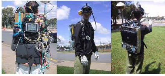
FIG. 8: Prototype réalisé du projet Tinmith [43]

Débuté en 2000, le projet " ARCHEOGUIDE : Augmented Reality-based Cultural Héritage On-site GUIDE" [14] vise à concevoir de nouvelles méthodes interactives pour l'accès aux informations sur l'héritage culturel. Ce système est composé essentiellement d'un ordinateur portable, d'un casque HMD, d'écouteurs, d'un microphone et d'une caméra. En fonction de la position du visiteur sur le site, ARCHEOGUIDE filtre les informations n'affichant que celles qui correspondent aux monuments perçus par l'utilisateur. De plus, l'interface développée permet de choisir entre plusieurs thèmes (en différentes langues) et supports multimédia. ARCHEOGUIDE offre surtout la possibilité de visualiser en 3D les parties endommagées des vestiges reconstruits en images de synthèse.