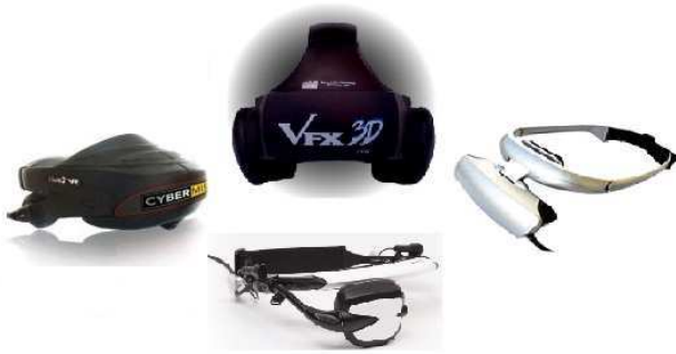
FIG. 5: Exemples de casques HMD