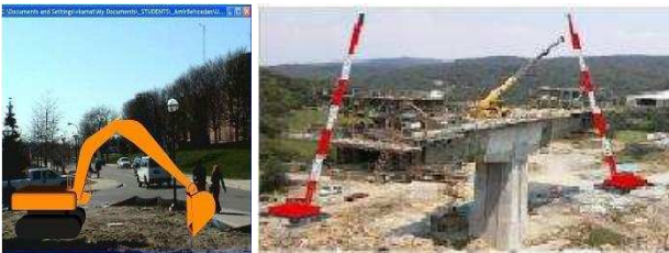
FIG. 10: Exemples d'augmentation pour la construction [3]

Mené au sein de l'université du Michigan (département d'ingénierie civile et environnemental), la plate-forme UM-AR-GPS-ROVER [3] permet de visualiser des modèles virtuels de construction dans un environnement urbain (dans des chantiers de construction par exemple). Le système se compose d'un récepteur GPS associé à un capteur d'orientation (une centrale inertielle), d'un casque de visualisation HMD, d'une caméra, et d'un ordinateur portable.