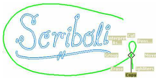
FIG. 2: Scriboli

Il existe plusieurs dispositifs pour l'interaction 3D sur terminaux mobiles, à savoir : les écrans tactiles, les touches, les caméras, et les positions et orientations. Pour les écrans tactiles, par exemple, les interactions se font surtout à base de geste, de dessin ou de pointage.