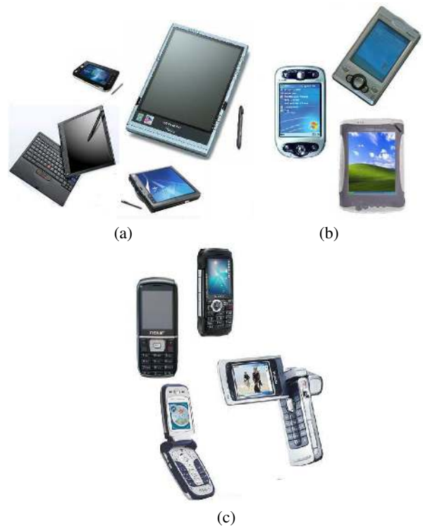
FIG. 4: Dispositifs de visualisation mobile : (a) Tablettes Pc (b) PDAs (c) Téléphones cellulaires

Sur le marché, on trouve un grand nombre de variété de ce type de dispositif. Le plus basique est bien évidemment l'écran de PC,