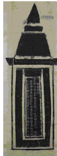
FIG. 1 – Image originale de stèle.

Une première base de données a été réalisée par l'EFEO (l'École Française d'Extrême-Orient) sur les stèles vietnamiennes numérisées et les annotations associées. Cette base d'environ 30 000 stèles (conservées à l'institut Han-Nôm) permet de conserver un grand nombre d'informations, mais n'offre pas de technique aisée d'exploration des données et de recherche d'information.