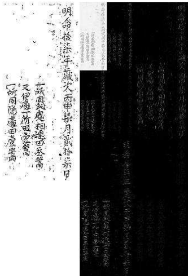
FIG. 2 – Exemple de binarisation par combinaison de la transformée multirésolution de Hadamard et la méthode d'Otsu.