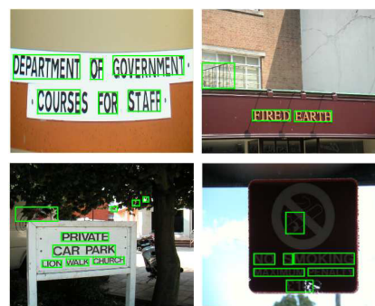
FIG. 2 – Exemples de détection et localisation de texte

Finalement, la cascade et le localiseur sont évalués sur la