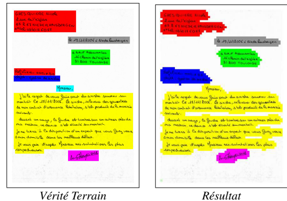
FIG. 2 – Exemple de structuration obtenue avec AMBRES (Jaune : corps de texte ; Rose : signature ; Cyan : ouverture ; Rouge : expéditeur ; Vert : destinataire ; Gris : date, lieu ; Bleu : objet)

Un taux d'erreurs global de 10.7% a été atteint sur la base de données RIMES-1. Un exemple de structuration donnée par AMBRES est illustré figure 2. Dans cet exemple un taux d'erreurs de 5.3% a été obtenu.