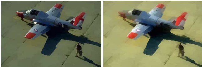
(c) t = 5, p = 1, \lambda = 0.01