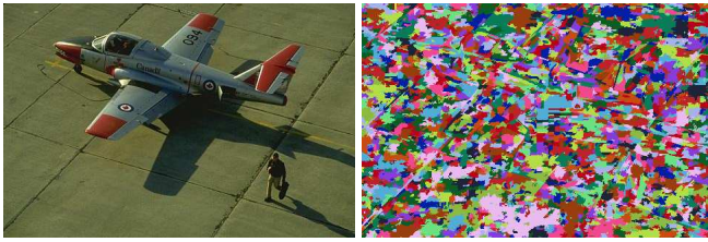
(a) Image originale (150072 pixels) (b) Zones homogènes (3011 régions)