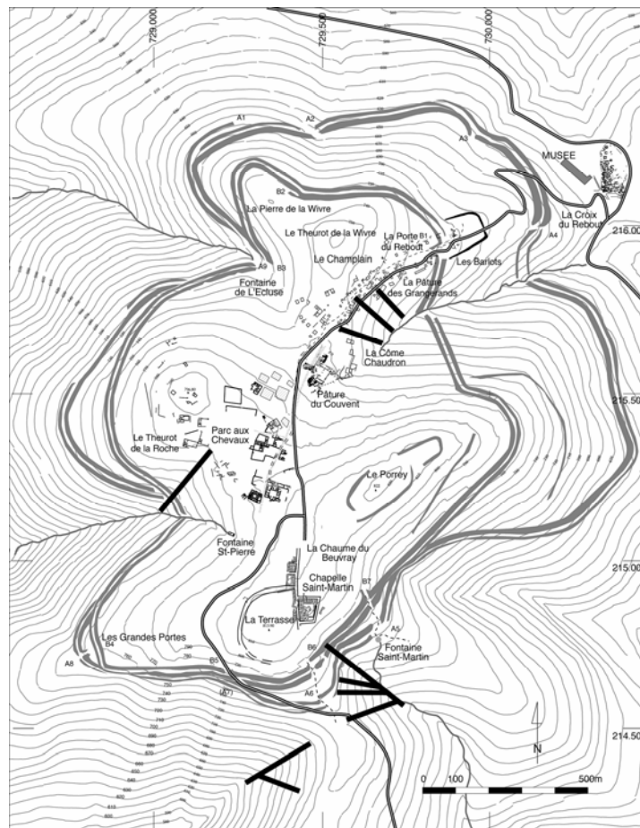
Fig. 5 : Bibracte, Mont Beuvray (F. Bourgogne). Emplacement des minières (en noir) découvertes en 2000 sur le Mont Beuvray.

Le Morvan, massif hercynien composé de granites, de roches volcano-sédimentaires et de roches détritiques paléozoïques, contient de véritables richesses métallifères. Ainsi, ont été inventoriés 193 indices de minéralisations métalliques (or : 7, argent : 17, plomb : 52, cuivre : 29, étain : 18, zinc : 21 et fer : 49) pouvant correspondre à autant de sites potentiels d'exploitation minière ancienne (Petit et al. 2003). Des traces d'activités minières anciennes ont également été signalées récemment par J.-P. Guillaumet (2001).