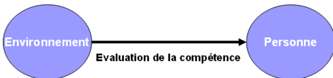
Figure 1 Le modèle unidimensionnel de la compétence

Pourtant, l'efficacité et la performance ne suffisent pas pour considérer que la compétence soit acquise par l'individu, le hasard peut aussi expliquer une performance à un moment donné ou dans des circonstances particulières. Le relevé de performances constitue plutôt un « indicateur plus ou moins fiable de la compétence » (PERRENOUD P., 1995) et si les performances remplissent des conditions d'efficacité, de reproductibilité et de régularité, alors on en inférera généralement l'existence d'une compétence. Nous constatons donc une différence de nature entre performance et résultat d'un côté et compétence de l'autre (JONNAERT P., 2006). En effet, « définie conventionnellement, une performance est une