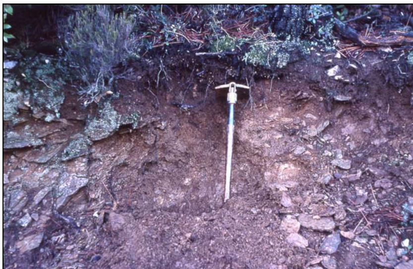
Photo 3 - Ranker sur poche d'arène non rubéfiée, dans le bassin versant du Rimbaud.