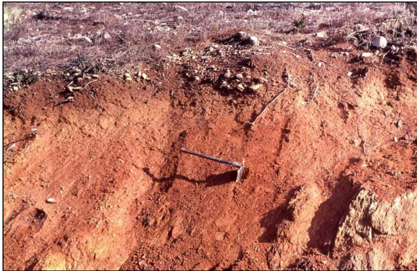
Photo 1 - Profil à sol rougeâtre sur le replat à l'est du plateau du Treps.