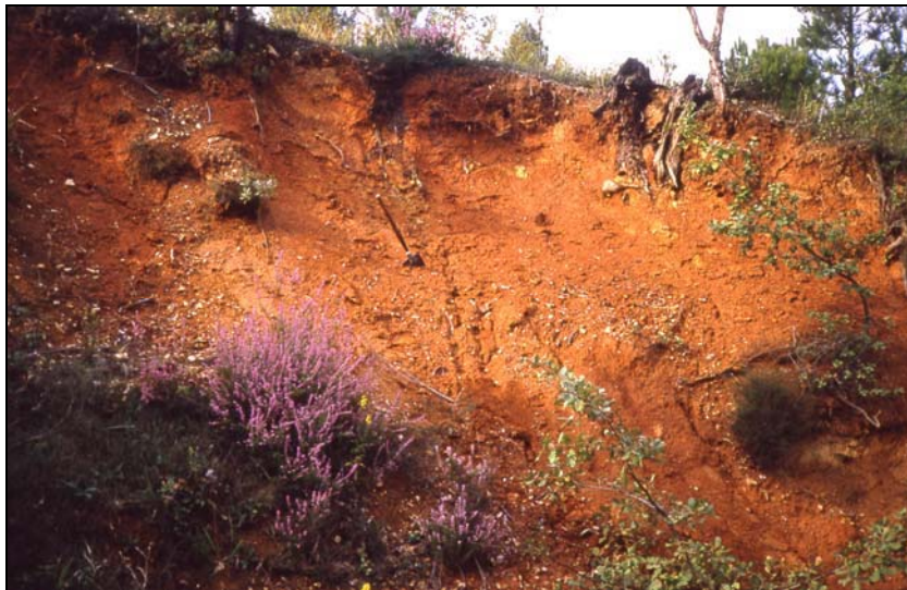
Photo 2 - Profil à sol rougeâtre au bas du col de Vignon, au pied de la retombée septentrionale des Maures, à 140 m d'altitude seulement.