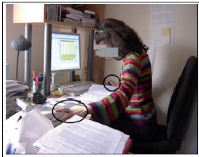
Figure 3 : Exemple d'étirement. Le buste et le visage sont orientés de face et vers le bas, marquant la lecture en cours du cahier des tâches. Le bras gauche est en extension vers le téléphone, et la main gauche, qui vient de « réveiller » cet artefact d'un geste préparatoire (ce qui projette la composition d'un numéro au clavier comme prochaine action pertinente) posée sur le téléphone. De manière similaire, la main droite est en suspension au-dessus de la souris, réveillée peu de temps

Pour gérer simultanément sa mobilisation d'une application informatique et du téléphone, elle étire son corps entre la souris (sur laquelle se fixe la main droite) et le téléphone fixe (sur lequel est posée la main gauche), tout en baissant la tête et les yeux pour consulter le cahier des tâches ouvert devant elle (Figure 3). A travers ces étirements et flexions des segments supérieurs, la personne manifeste la pertinence simultanée de trois types d'action : lancer une application logicielle, composer un numéro de téléphone, consulter le cahier des tâches. Le corps propre étiré vient combler le « hiatus » les perceptions associées à chacune des mains (Merleau-Ponty, 1964), et les deux orientations auxquelles elles correspondent.