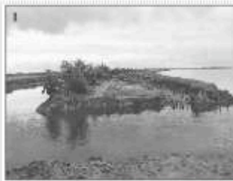
Photo 1 : brèche accidentelle du polder de Graveyrie (bassin d'Arcachon) / The accidental breach of the sea-dike at Graveyrie Polder (Arcachon Basin, France).