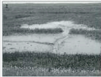
Photo 3 (L. Goeldner, août 2006) : seize ans après la brèche, l'ancien digue séparant le polder Selexa de l'Écluse occidentale est à peine visible au sein d'une phragmitaie très uniforme. / Sixteen years after the breach, the former dike separating the Selexa's polder from the Western Scheldt is not easy to detect, inside a uniform reedbed.