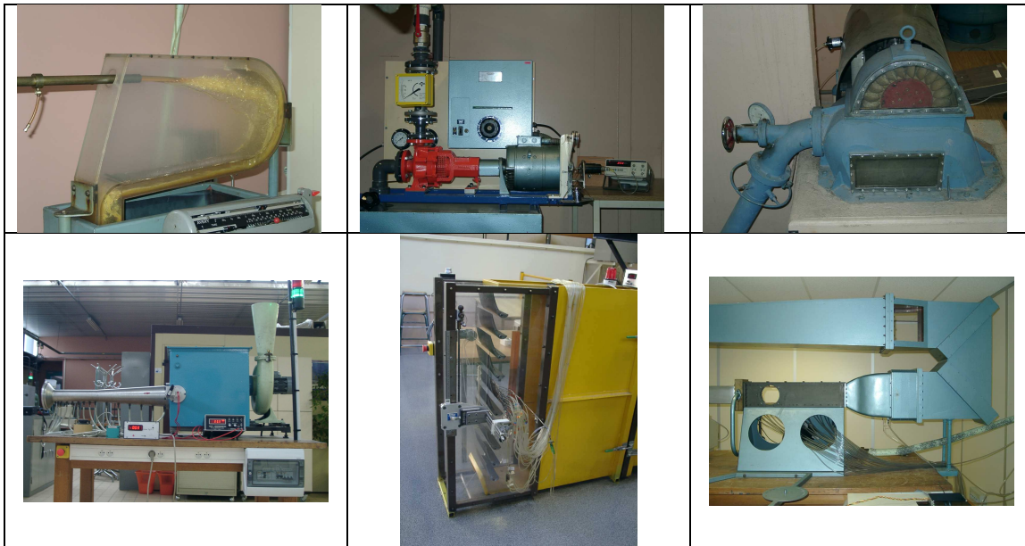
FIG. 1: Quelques-uns des bancs expérimentaux à disposition (de gauche à droite et de haut en bas : conduite à huile, pompe centrifuge, turbine Pelton, banc aérouliquue avec diffuseur, grille d'aubes, soufflerie supersonique).

Pour illustrer leur thème, les élèves disposent de 18 installations expérimentales (quelques-unes étant présentées sur la Fig. 1). La liste en est donnée ci-dessous (certains postes sont multiples) :