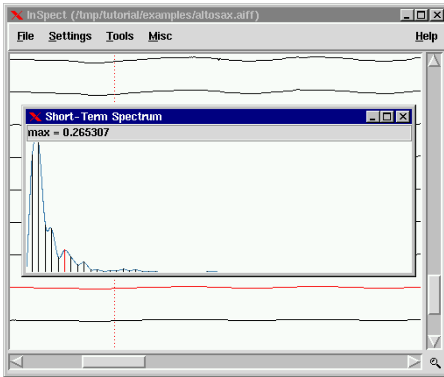
FIG. 2: InSpect affichant les évolutions dans le temps des fréquences des partiels d'un son de saxophone alto (sur 0.7 secondes). Au premier plan est affiché un spectre à court terme ainsi que l'enveloppe spectrale correspondante.