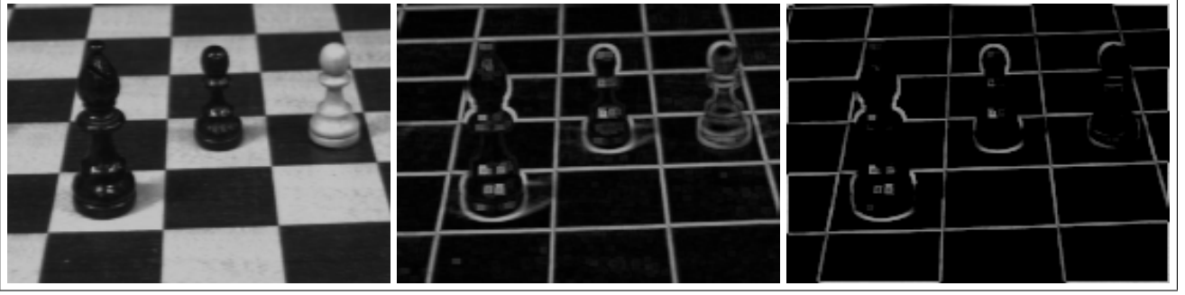
Figure 2 – Image originale - Gradient morphologique - Similarité locale avec \mathcal{N}_{3,18} et (\top, \perp)_S

l'opérateur \Phi_{j,k}(u) . Les résultats que nous donnons ici reposent sur l'utilisation des normes classiques du Tableau 1. Parmi les différentes possibilités pour la fonction noyau, nous avons choisi le noyau gaussien défini par l'équation (7). Arrêtons-nous sur le choix du paramètre de résolution \lambda qui s'avère prépondérant puisqu'il influe sur la contribution des valeurs à agréger, selon différentes situations :