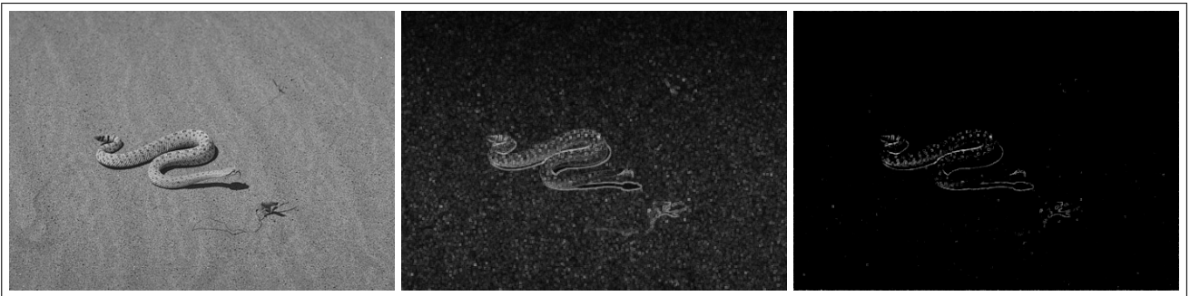
Figure 4 – Image originale - Gradient morphologique - Similarité locale avec \mathcal{N}_{3,18} et (\top, \perp)_L

que les bords des objets sont conservés, alors que le gradient morphologique ne supprime pas le bruit du fond. Les contours obtenus grâce à cette méthode sont identiques à ceux désirés par les humains. De manière générale, l'utilisation de différentes normes triangulaires n'influe pas beaucoup sur le résultat final : l'effet "filtrage" est moins strict avec (\top, \perp)_S que avec (\top, \perp)_L . Il pourrait être intéressant de mettre en oeuvre des normes triangulaires paramétriques (Yager, Dombi, etc ...).