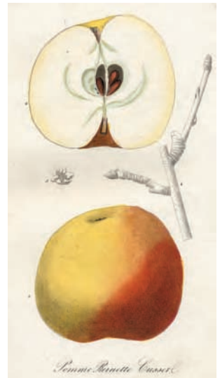
La reinette Cusset, variété trouvée dans les monts du Lyonnais au XIXe siècle par M. Cusset. Extrait de Flore et pomone lyonnaise de N.-C. Seringe, 1847, Lyon, Société d'horticulture du Rhône.