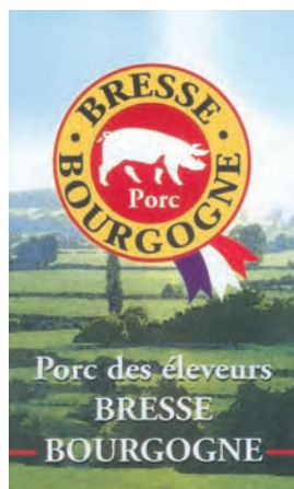
La communication sur le lieu est omniprésente.

Cette grille de lecture regroupe l'ensemble des produits dont le lieu fait sens et permet de faire un premier tri, en particulier dans le cas des produits de terroir. Nous utilisons par commodité cette expression, très répandue en France, pour parler des productions localisées, mais elle est perturbante car elle confond origine et provenance. La situation est la même pour les produits fermiers, assimilés la plupart du temps à des produits de terroir. Or, ils n'ont d'autre particularité que d'être élaborés à l'échelle de l'exploitation agricole et à partir des matières premières que celle-ci fournit. Ils peuvent entrer dans la catégorie des productions localisées s'ils renvoient à la culture locale. Un foie gras fabriqué à la