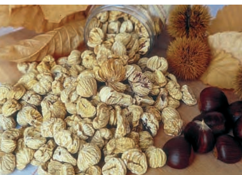
Les châtaignons, petite châtaignes séchées, se consomment traditionnellement sous forme d'une soupe, appelée « cousina » en Ardèche.

Les châtaignons, châtaignes ardéchoises séchées à la fumée, sont d'une grande dureté. Ce ne sont pas des fruits secs que l'on peut offrir à l'apéritif comme l'ont cru des touristes ignorants : ils doivent être mis à tremper une nuit avant d'être accommodés, le plus souvent sous la forme d'une soupe nommée cousinat. Le ramequin du Bugey, fromage fabriqué dans l'Ain, est im-mangeable tel quel : finement coupé, il est lentement délayé dans l'eau à la manière d'une fondue, dont il emprunte le mode de consommation.