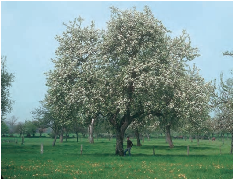
Pré verger et variétés locales constituent les éléments centraux de la production cidricole en Normandie. Poiriers à poiré dans le Domfrontais, berceau du poiré Domfront et du calvados Domfrontais, tous deux AOC. Saint-Roch-sur-Egrenne, Orne, 1985.