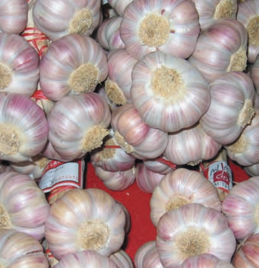
L'ail de Lautrec, présenté en « manouilles », Indication géographique protégée depuis 1996.