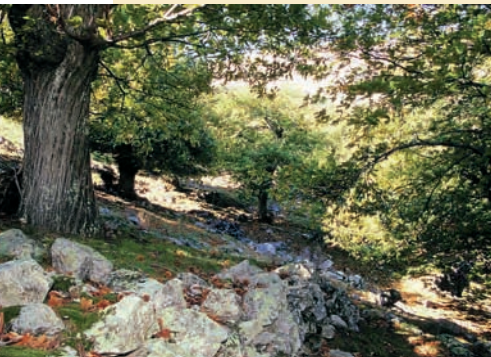
La châtaigneraie ardéchoise.

L'AOC « châtaigne d'Ardèche », obtenue en juin 2006, retient dix-neuf variétés principales, sur soixante-cinq recensées, toutes locales, entraînant de facto la prise en compte des connaissances liées à leur maintien. Le décret précise que les variétés hybrides sont interdites et que la conduite des châtaigneraies ou des châtaigniers isolés est traditionnelle : basses densités de plantation (chaque arbre dispose de 100 mètres carrés au minimum) ; entretien régulier des châtaigniers et de la couverture végétale du sol, tout en permettant la culture de myrtilliers ou la présence de pâtures dans les vergers ; pas d'utilisation de fertilisants ou d'amendements chimiques, la production étant limitée à 100 kg par arbre. Le paysage – unique en son genre – constitue une empreinte culturelle marquée et la faune et la flore abritées par les grands arbres sont particulières.