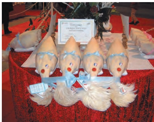
Les concours de volailles fines, appelés les « Glorieuses » en Bresse, sont des hauts lieux de la validation de la compétence. Grand prix d'honneur pour un lot de quatre chapons, Bourg-en-Bresse, Ain, 2002.

Comment les identifier et les prendre en compte dans une démarche de protection ? Les pratiques locales sont confrontées aux connaissances scientifiques et techniques, mais aussi à la tradition et aux modes de transmission qui sont fréquemment à l'origine des variantes rencontrées sur le terrain. L'élaboration d'un cahier des charges, à travers la mise à plat des pratiques, des savoirs qui leur sont associés, des définitions, met en lumière toutes les difficultés inhérentes à une codification de la culture technique locale.