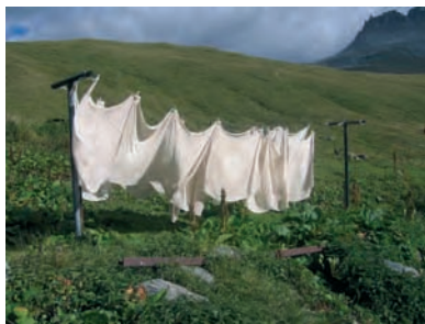
Les toiles qui servent à fabriquer le bleu de Termignon sèchent au vent des Alpes...