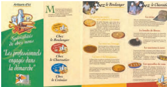
Dépliant, un des éléments du matériel de communication.