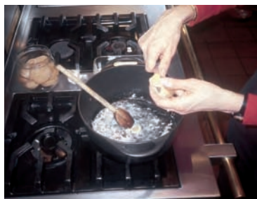
Le ramequin du Bugey, originaire de la région de Saint-Rambert-en-Bugey, Ain, se consomme à la façon d'une fondue.