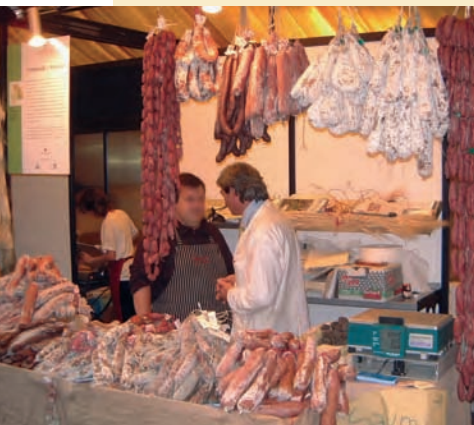
Le « Salone del gusto », rendez-vous international des producteurs et des consommateurs de produits locaux. Turin, 2002.

petits producteurs du monde entier tous les deux ans à Turin. Vitrine de toutes les activités de l'association, elle montre de façon convaincante la richesse et la diversité des cultures gastronomiques locales. Les organisateurs choisirent ce cadre pour lancer l'opération « L'Arche du goût » qui vise à recenser, faire connaître et réinsérer dans le circuit commercial les productions locales ignorées ou en risque d'extinction. Enfin, depuis 2003 l'« Université des Sciences gastronomiques » coordonne les savoirs multiples et les activités nombreuses ayant trait à l'alimentation en choisissant comme fil directeur la gastronomie. Présent dans 80 pays, le mouvement compte en France 1500 membres, qui se répartissent dans une vingtaine de groupes locaux, appelés « conviviums ». Le salon « Aux origines du goût » se tient à Montpellier depuis 2003 ; organisé selon un schéma inspiré du « Salone del gusto », il a lieu tous les deux ans en alternance avec ce dernier.