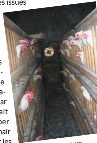
Finition des volailles de Bresse en épinettes. Saint-Denis-les-Bourg, Ain, 2005.

En Bresse, la querelle des anciens et des modernes concernant l'introduction du soja dans l'élevage des volailles a duré des années. Cette pratique remettant en question le système d'alimentation traditionnel – carencé en protéines – était encouragée par les abatteurs et certains éleveurs. Elle permettait d'abaisser les coûts de production et de développer l'élevage pour les uns ; elle modifiait le persillé de la chair et portait atteinte à la notoriété de l'appellation pour les autres. Les tensions restèrent vives pendant plusieurs années, jusqu'à ce que les décisions aient été prises une bonne fois pour toutes et consignées dans le règlement intérieur de l'appellation.