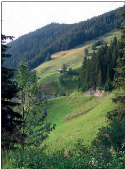
La puissance évocatrice de la montagne... Alpages vers le col du Pré, Boudin, Arêches, Savoie, 2005.

Beaucoup de producteurs montagnards engagés dans des demandes de protection considèrent que cette mention ne fait que brouiller un peu plus les cartes. Là encore, l'outil est ce qu'en font les hommes. Dans certains cas, cette démarche de valorisation s'inscrit clairement dans une logique d'aménagement du territoire ; dans d'autres, elle tire parti d'une image à moindre frais.