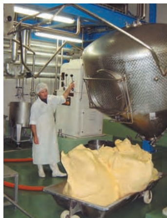
Fabrication du beurre de baratte à la Laiterie coopérative d'Étrez-Beaupont, Bresse, Ain, 2004

L'élaboration d'un produit est le résultat d'une succession de savoir-faire plus ou moins complexes, dont certains occupent une place déterminante ou requièrent une compétence particulière qui aide à la caractérisation de sa spécificité. Elles ne sont pas indispensables au déroulement du processus, contrairement à ce qui se passe dans une logique strictement technique, mais leur absence peut faire perdre au produit sa typicité. Ainsi, dans la fabrication de la rosette, le boyau naturel continue d'être utilisé par de nombreux artisans car c'est un élément central caractérisant la spécificité de ce saucisson. Il impose un travail de préparation important, mais l'épaisseur de sa paroi autorise un affinage