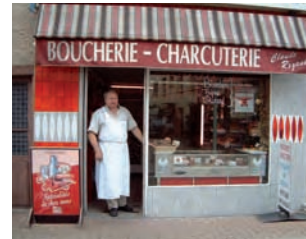
Une boucherie engagée dans la démarche « Artisans d'ici, spécialités de chez nous ». Montrevel, Ain, 2004.

Tels ont été les objectifs fixés dans le cadre d'une opération visant à valoriser les produits agricoles et alimentaires relevant du secteur des boulangeries, des charcuteries et des produits laitiers dans une partie de la Bresse, du Revermont et du Val de Saône (18). Les différentes phases de ce travail ont été réalisées en collaboration étroite avec les professionnels. Des enquêtes préalables, complétées par des recherches documentaires, des réunions, des entretiens individuels, ont permis d'identifier les produits retenus. Les discussions menées avec les syndicats et représentants des différents secteurs artisanaux se sont orientées vers une forme de protection légère,