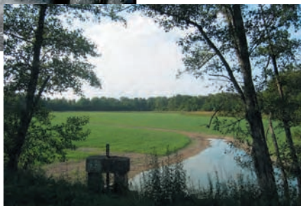
Le cycle des étangs de la Dombes fait alterner élevage de poisson et culture de céréales sur une même surface. Pêche de l'étang Chaffange à Saint-André-le-Bouchoux, 1984 et culture en avoine dans l'étang Renolly à Saint-Paul-de-Varax, Ain, 2005.

L'agro-pisciculture pratiquée dans les étangs de la Dombes (Ain) est orientée vers l'élevage de la carpe. Cette activité n'est pas récente ; elle doit son émergence, au Moyen-Age, à la nécessité de se procurer du poisson à une époque où les prescriptions alimentaires étaient fortes. Elle repose aujourd'hui sur un système extensif qui fait alterner pisciculture et céréaliculture sur un même sol. Cet assolement particulier génère un ensemble de pratiques techniques et culturelles complexes qui produisent de la biodiversité, en préservant, notamment, un grand nombre d'espèces animales et végétales sauvages, y compris au niveau du plancton et des micro-organismes de l'eau et du sol. Les régimes de faire-valoir et les modes d'appropriation du sol, la grande diversité des catégories d'utilisateurs du milieu, les pratiques spécifiques, le poids des activités cynégétiques constituent les principaux paramètres qui déterminent le fonctionnement de ces étangs « cultivés ». Ici, le paysage présente la particularité de changer complètement de physionomie au fil des périodes d'eau et d'« assec ». La carpe et le brochet de la Dombes postulent actuellement pour une Indication géographique protégée.