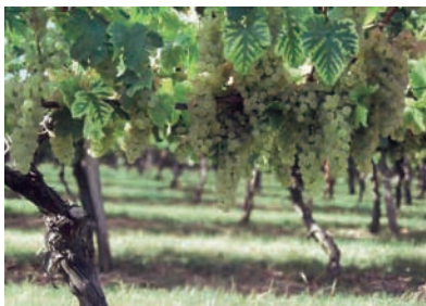
Sur les coteaux qui entourent la ville, les chassellatiers continuent de prendre le plus grand soin de leurs vignes et des grappes. Chasselas de Moissac.

Les savoirs et pratiques vernaculaires se sont construits à partir de l'expérience acquise et de l'observation. Ils coexistent avec les savoirs scientifiques et techniques qui les pénètrent plus ou moins selon les