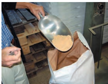
Les gaudes, bouillie préparée à partir de farine de maïs grillé, ont longtemps constitué l'aliment de base des Bressans. Moulin Taron, Chaussin, Jura, 2003.