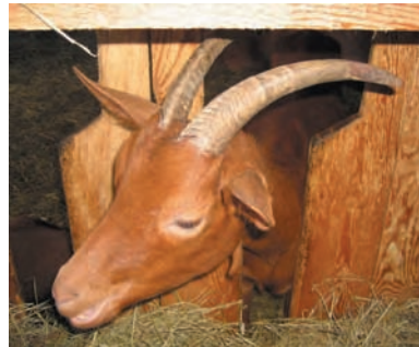
Nombreux sont les fromages au lait de chèvre dans les Alpes du Nord. Le grataron d'Arèches, un proche cousin du chevrotin.

C'est incontestablement dans les Aravis que la production de chevrotin est la plus structurée. Les éleveurs installés dans ce massif sont d'ailleurs à l'origine de la demande d'AOC – obtenue en 2002 – basée au départ sur le chevrotin « des Aravis ». Ceux des autres massifs manifestèrent leur désir de rejoindre le projet, mais sous quelle dénomination ? En effet, au-delà des Aravis, l'antériorité de la fabrication et