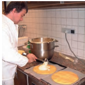
Fabrication du fromage blanc en faiselle (beurrerie coopérative de Foissiat) et de la galette à la crème (Saint-Etienne-du-Bois), deux produits de la Bresse, 2002.