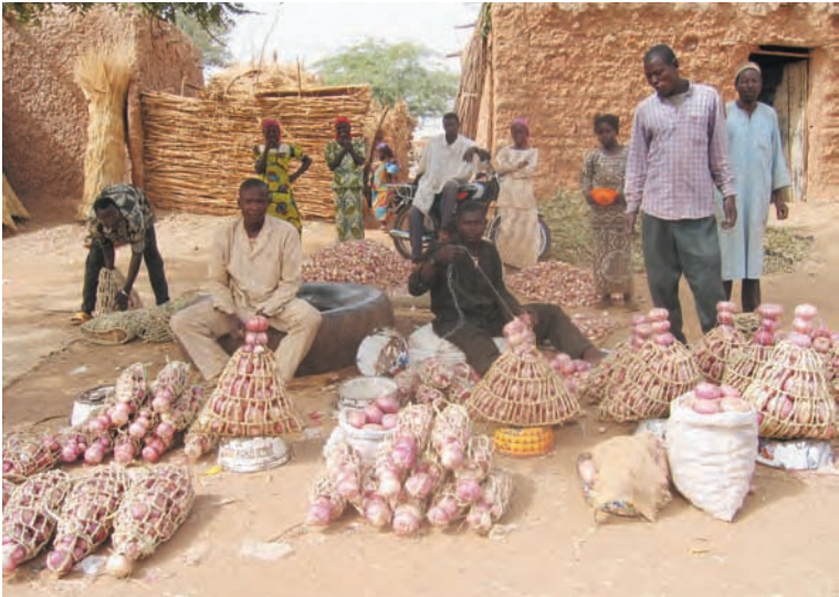
Une production localisée de grande importance au Niger : l'oignon de Galmi. Niger, 2006.

A ce jour, le parmesan est une marque déposée aux Etats-Unis et les producteurs italiens de cette AOP n'ont pas le droit d'y vendre leur produit sous ce nom... Pourtant, indications géographiques et marques ne sont