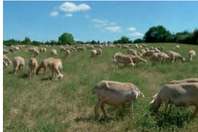
Le roquefort, fromage au lait de brebis, est la première AOC française, obtenue en 1925. Brebis sur le Causse de Nissac, Aveyron.

La loi de 1919 fait émerger la notion d'appellation d'origine et l'associe à un droit collectif de propriété, sans qu'une définition légale n'en soit donnée ; elle reconnaît officiellement les syndicats de défense de l'appellation. Le décret-loi de 1935 enfin, par la création d'un Comité qui deviendra l'Institut national des appellations d'origine (INAO) en 1947, constitue le fondement des Appellations d'origine contrôlée. Désormais, aucune AOC viticole ne pourra voir le jour si le Comité n'a pas pris une décision favorable, en approuvant un texte la définissant. La loi du 2 juillet 1990 élargit l'Appellation d'origine contrôlée à l'ensemble du secteur agro-alimentaire et la fait reposer sur les mêmes règles.