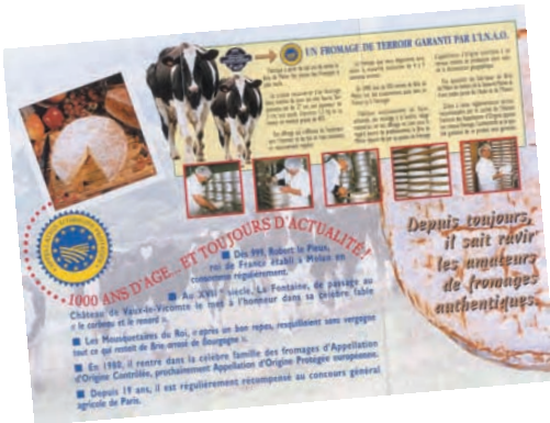
Un brie hors d'âge...

hasard, l'erreur, la légende et des personnages célèbres de toute espèce. L'origine est souvent « ancestrale », date de la « nuit des temps » ou renvoie à la légende, volontiers imprégnée de hasard. Le roquefort vit le jour grâce à un berger ayant précipitamment quitté la grotte où il se trouvait en laissant un quignon de pain et un morceau de fromage. Quelque temps plus tard, il retrouva un fromage devenu bleu et goûteux, raconte l'histoire.