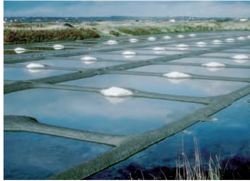
Le sel est considéré comme produit industriel par l'Union européenne et ne peut pour l'instant bénéficier de la protection de l'Indication géographique. Marais salant de Guérande, 1987.

Plus que l'ancrage historique, ce sont les savoir-faire collectifs qui constituent le critère le plus opérationnel pour rendre compte de la nature du lien. Le Bleu de Bresse – marque déposée – bénéficie déjà d'une certaine antériorité puisqu'il est fabriqué dans l'Ain depuis une soixantaine d'années ; mais il ne repose pas sur des pratiques partagées localement : il est le fait d'un directeur de coopérative particulièrement dynamique et inventif qui a mis au point ce fromage dans l'après-guerre. On peut en dire autant des créations des pâtisseries et des confiseurs.