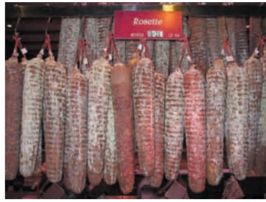
Rosette et saucisson de Lyon se ressemblent ; et pourtant ce sont deux charcuteries fort différentes. Halles de Lyon, 2005.