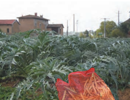
Deux légumes emblématiques d'un lieu : le cardon de la région lyonnaise et le coco de Paimpol AOC en Bretagne.

Ce dispositif, s'il est bien adapté à la création actuelle et aux obtentions récentes, pose problème dès lors que l'on a affaire à des types locaux, qui peuvent être « trop » hétérogènes et subir des variations au sein d'un ensemble. Les critères mêmes de DHS obligent à une réflexion sur ce qui identifie la variété ou la population locale utilisées pour la production sous signe de qualité ou d'origine. Toute fixation de l'assortiment variétal ou des populations dans un cahier des charges peut conduire à une forme d'appauvrissement par rapport à un état de référence. D'un autre côté, il serait utopique de vouloir tout conserver. Il s'agit par conséquent de