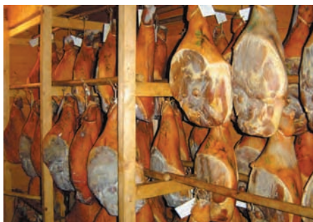
En Savoie, toutes les salaisons sont fumées... chez les particuliers (en haut) comme chez les artisans (en bas). Val d'Abondance, 2005.