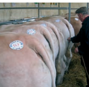
L'évaluation de l'état d'engraissement du bœuf de Charolles se fait en touchant une zone particulière de la bête. Concours de bovins charolais à Roménay, Saône-et-Loire, 2006.

Autre exemple : contrairement à ce qui se passe dans le mode industriel de fabrication du beurre, toutes les crèmes destinées à faire le beurre en Bresse subissent au préalable une maturation biologique qui leur permet de développer leurs arômes. Ceci est un des points de caractérisation les plus importants. Une fois maturée, la crème est rapidement transformée et l'on veille à limiter les manipulations pour lui conserver toutes ses qualités, un soin qui traduit une culture partagée du produit.