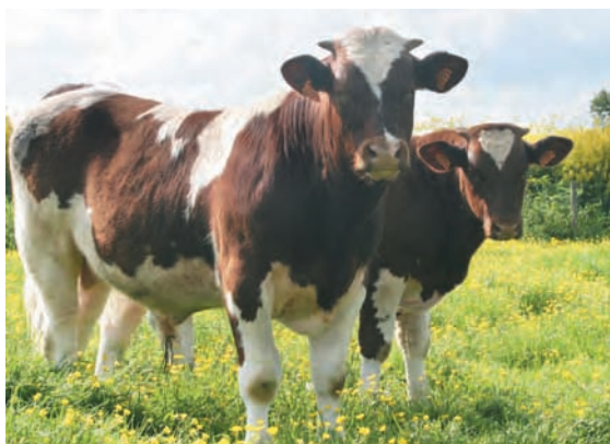
L'AOC Maine-Anjou, réputée pour la qualité de sa viande.

D'autres AOC intègrent la race locale dans leurs conditions de production : Maine-Anjou (rouge des prés, ex Maine-Anjou rebaptisée pour être en conformité