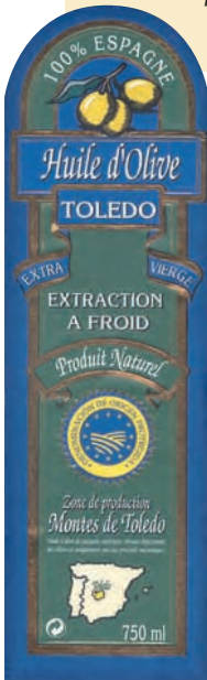
Les AOP commencent à circuler en Europe. Etiquette d'une huile d'olive d'Espagne.

Ces textes ont été remplacés par le règlement (CEE) du 20 mars 2006, N° 510/2006, relatif à la protection des indications géographiques et des appellations d'origine des produits agricoles et des denrées alimentaires et par le règlement (CEE) du 20 mars 2006, N° 509/2006 relatif aux Spécialités traditionnelles garanties des produits agricoles et des denrées alimentaires.