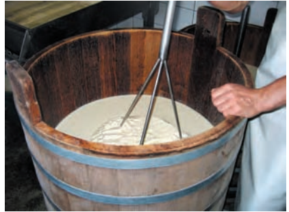
Le salers, fromage fermier AOC, se fabrique d'avril à novembre. Le caillage a lieu dans une gerle en bois. Région d'Aurillac, Cantal, 2006.

La transmission – ici dans le cadre de l'apprentissage – peut s'effectuer par l'intermédiaire d'acteurs occupant une place spécifique dans la société locale ou dans la famille. La transmission peut être relayée par d'autres maillons, en fonction de la recomposition des sociétés rurales, en particulier dans les milieux les plus difficiles qui souffrent souvent de désertification et sont plus perméables