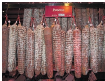
Rosette et saucisson de Lyon se ressemblent ; et pourtant ce sont deux charcuteries fort différentes. Halles de Lyon, 2005.