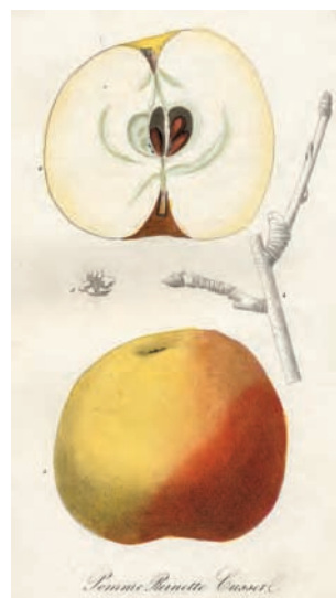
La reinette Cusset, variété trouvée dans les monts du Lyonnais au XIXe siècle par M. Cusset. Extrait de Flore et pomone lyonnaise de N.-C. Seringe, 1847, Lyon, Société d'horticulture du Rhône.