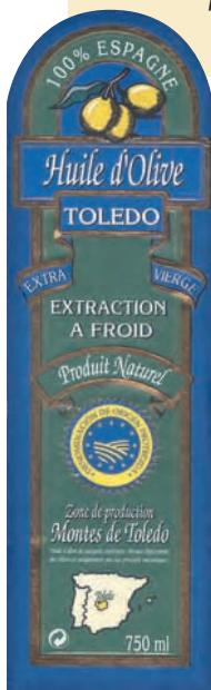
Les AOP commencent à circuler en Europe. Etiquette d'une huile d'olive d'Espagne.

des qualités particulières. Elle n'impose pas une zone unique où doit se dérouler l'ensemble des opérations : les matières premières en particulier peuvent provenir d'ailleurs.