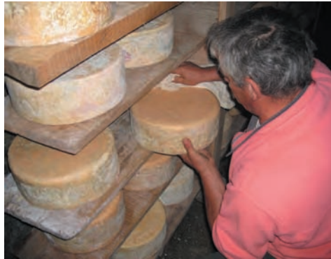
Sur l'alpage d'Entre deux eaux, en Vanôise : cave d'affinage pour le bleu de Termignon, Savoie, 2005.

Toutefois, la prise en compte de cette diversité se heurte aux effets de la mondialisation. En effet, l'internationalisation des échanges associée à la libre circulation des biens génère et impose des normes de plus en plus contraignantes. Ces règles ont été conçues pour des productions industrielles et prennent très peu en compte, ou au coup par coup, les caractéristiques liées aux petites unités de fabrication et aux productions locales. Il importe, pour leur survie, de réfléchir à des normes adaptées à leur spécificité et à des unités de fabrication de petite taille. Si l'obligation de résultat est indiscutable – il ne s'agit pas de mettre sur le marché des produits dangereux pour la santé – une interprétation raisonnée et raisonnable des textes devrait permettre aux opérateurs de conserver leurs savoir-faire.