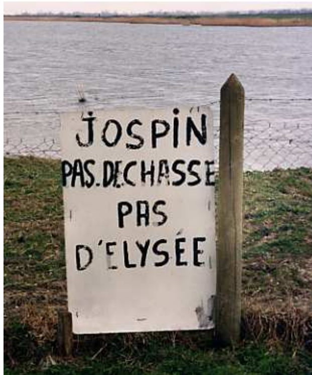
Document 3 : « revendications » des chasseurs de gibier d'eau dans les Bas-champs de Cayeux (photo : V. Bawedin, 2000)

Ainsi, la propriété privée, plus que la chasse, est un facteur qui peut impulser le choix du maintien en l'état des Bas-champs.