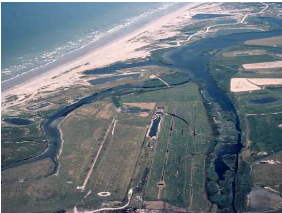
Document 4 : vue aérienne des Bas-champs, avec le Hâble d'Ault, ancienne lagune aujourd'hui en réserve de chasse, et des zones humides appartenant au Conservatoire du Littoral.

Les joyaux naturels des Bas-champs (document 4) sont représentés par des espèces d'oiseaux rares au niveau national, voire européen, inscrites à l'annexe 2 de la convention de Berne et qui trouvent ici l'un des rares sites de reproduction régional : Butor étoilé ( Botaurus stellaris ), Grand gravelot et Gravelot à collier interrompu ( Charadrius hiaticula et C. alexandrinus ), Panure à moustaches ( Panurus biarmicus ). Il en est de même pour les plantes : citons, parmi les espèces rares et protégées : le Gazon d'Olympe ( Armeria maritima ), la Litorelle des étangs ( Littorella lacustris ), l'Orchis ignoré ( Dactylorhiza praetermissa )...et le Chou maritime ( Crambe maritima ). Il est intéressant de noter que toutes les stations de plantes rares sont situées au nord de la D 102 qui relie Cayeux à Brutelles, soit dans la zone la moins directement menacée d'inondations.