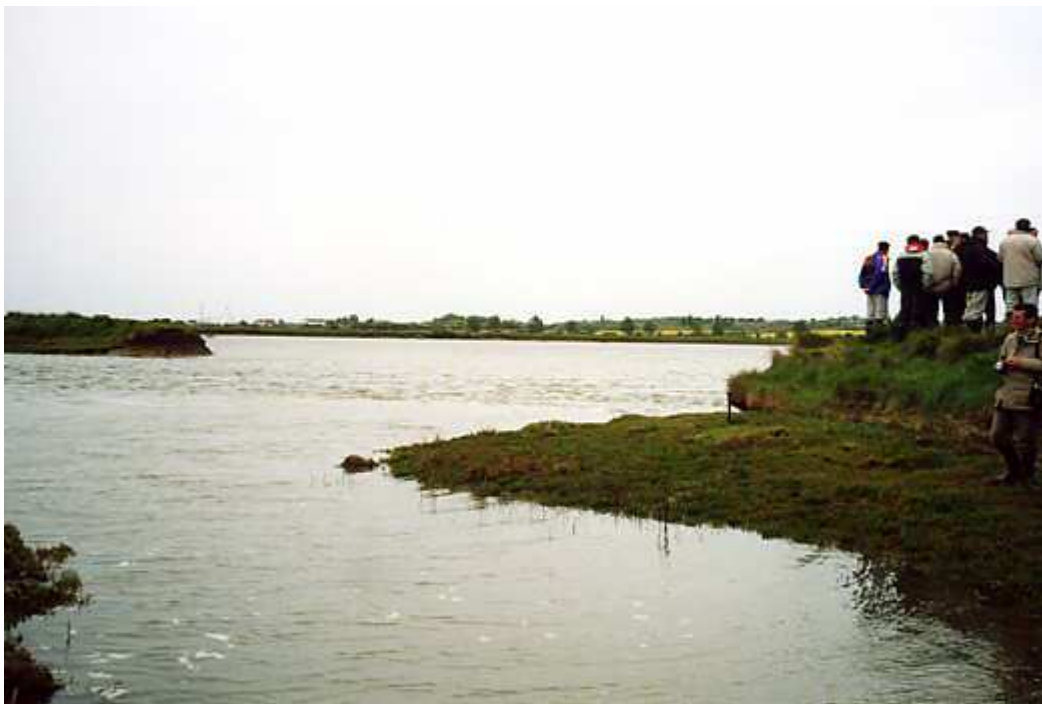
Document 1 : Site dépoldérisé de Tollesbury (Essex, Angleterre) : des visiteurs sur la digue, près de la brèche laissant revenir l'eau de mer (photo : V. Bawedin, mai 2003).

Ces deux exemples anglais montrent l'attention portée par les pouvoirs publics aux phénomènes de lutte contre l'élévation du niveau de la mer, d'une part, de protection de l'environnement d'autre part, les deux étant ici complémentaires. Cela traduit une anticipation, une vue à long terme dont ces travaux sont la résultante, fait relativement rare quand il s'agit de gestion du littoral.