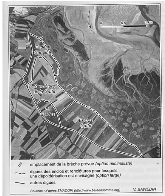
Document 6 : projet de dépoldérisation au sud de l'estuaire de la Somme