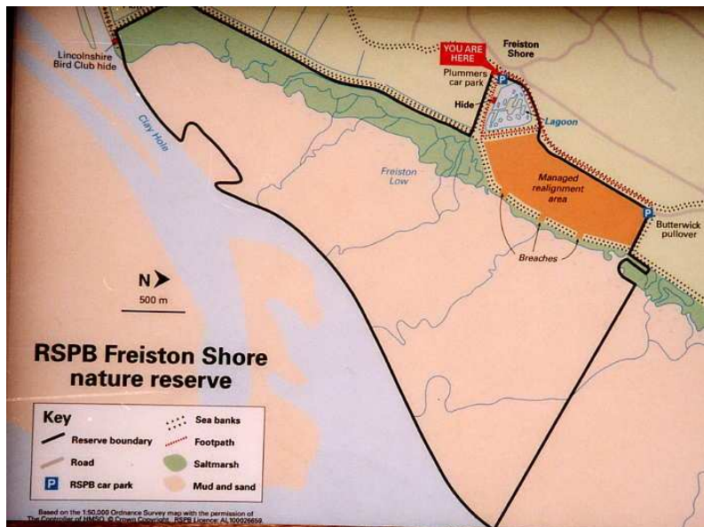
Document 3 : Panneau explicatif apposé à l'entrée de la Réserve, indiquant le procédé de dépodérisation utilisé (Baie de Wash, photo : V. Bawedin, mai 2003)

Il s'agit du site dépodérisé le plus récent puisque sa réouverture à la mer, faite par la percée de trois brèches larges de 50 mètres dans la digue, date de 2002. Là encore, la dépodérisation est utilisée à des fins de protection contre la mer par la volonté de gains d'herbus caractérisant le schorre, même si la réalisation très récente de cette opération ne permet pas, pour l'instant, d'en voir les résultats.