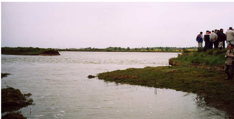
Document 1 : La brèche longue de quelques dizaines de mètres sur le site de Tollesbury, qui devient un lieu de visite (photo : V. Bawedin, mai 2003).

Le but ici était double : favoriser le retour du schorre, en voie de raréfaction en Angleterre étant données les poldérisations nombreuses qui ont eu cours, et expérimenter un retrait contrôlé pour évaluer les potentialités des prés salés à défendre les côtes contre l'élévation de la mer. Cette technique de retrait, bénéfique tant d'un point de vue écologique qu'humain et économique, est maîtrisée et contrôlée par les aménageurs, d'où son nom de « retrait contrôlé » (Goeldner, 1999), ou encore retrait planifié. L'ensemble des acteurs locaux salue aujourd'hui cette initiative, les riverains participant même au suivi de l'évolution du schorre.