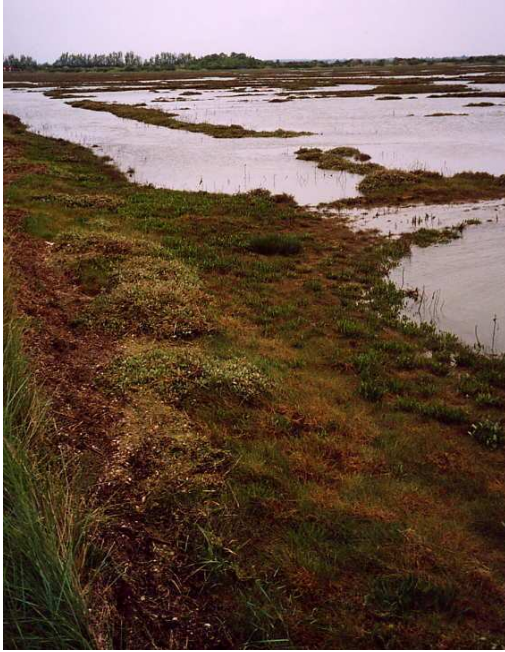
Document 2 : Un schorre s'est reconstitué très rapidement sur le site après la dépodérisation. (Tollesbury, photo : V. Bawedin, mai 2003).