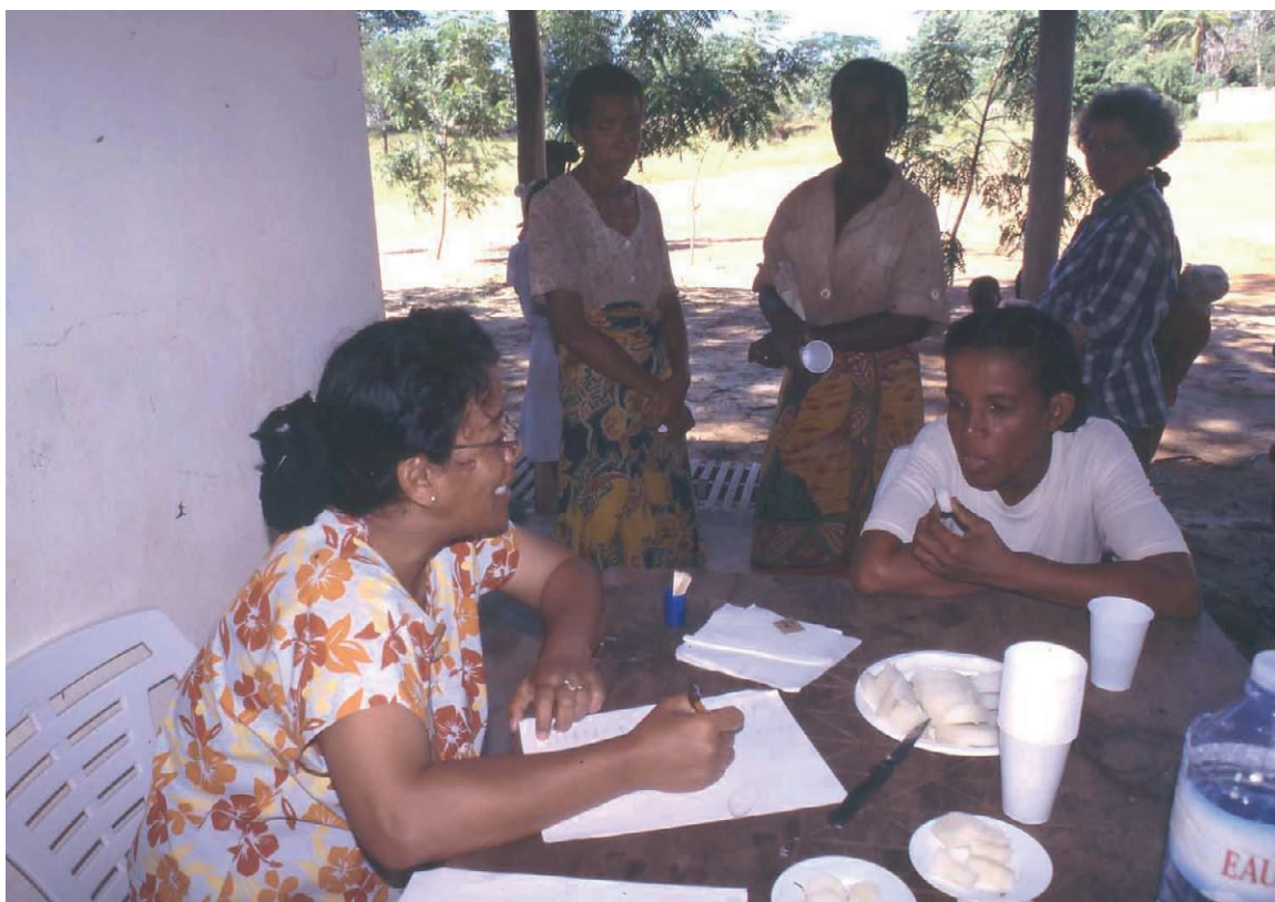
Figure 5. Tests de dégustation d'ignames sauvages sous les formes habituellement consommées, cuites (deux espèces, 'ovy' et 'bako') ou crues (deux autres espèces, 'sosa' et 'babo'), en utilisant une échelle des réponses hédoniques analogue à celle des réponses calibrées avec des substances pures.

Les profils de perception et d'appréciation ne sont en général pas corrélés. Le niveau de préférence peut augmenter ou baisser en fonction des concentrations, selon les individus, notamment pour les solutions de sucre : le profil de réponse hédonique présente souvent un pic à la concentration préférée. Les premiers résultats obtenus à Madagascar ont été reportés sur le Tableau I en utilisant les notations des types proposés en 1977 par Thompson et al. (' sweet likers '). Lorsqu'un sujet porte des notes croissantes, puis une note plus faible pour décrire l'appréciation de la solution la plus concentrée, il est dit "sweet liker de type I". Si le sujet attribue des notes de plus en plus élevées en fonction des concentrations croissantes de sucre, il est appelé "sweet liker de type II". Les autres sujets, plus rares dont les notations décroissent avec les concentrations de sucre sont nommés « sweet dislikers ». Par extension, nous employons des termes comparables pour décrire les amateurs des solutions à goût salé ou amer : respectivement "salt liker" et "PROP liker" (PROP = 6-n-propylthiouracile). Les proportions de ces groupes sont comparées avec les résultats obtenus en France en utilisant un protocole identique (Tableau I). La fréquence des "sweet likers" est plus élevée à Madagascar (total des types I + II = 78 %), alors qu'en France elle atteint seulement 47 %.