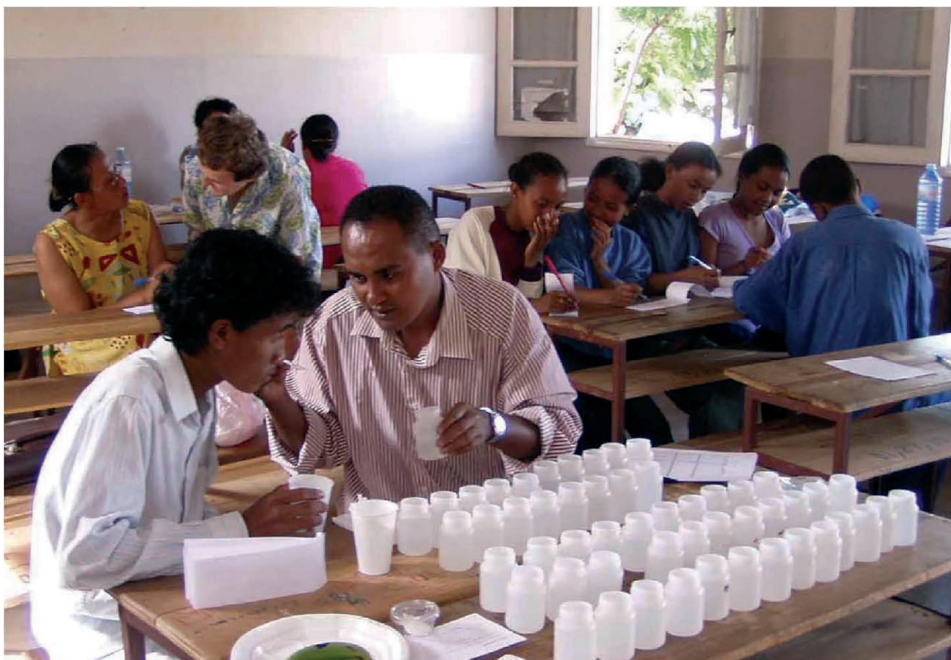
Figure 2. Tests de détermination des seuils de perception gustative dans un Lycée d'Antananarivo. Pour chaque produit, une série de solutions, dans l'ordre décroissant des concentrations, était préparée : fructose (10 dilutions de 1000 à 1 mM/l), saccharose (10 dilutions de 200 à 1,5 mM/l), chlorhydrate de quinine (13 dilutions, de 400 à 0,4 \mu M/l), chlorure de sodium (12 dilutions de 250 à 0,5 mM/l), acide citrique (8 dilutions de 25 à 0,2 à mM/l).

Pour ces tests psychophysiques en simple aveugle, nous utilisons des substances qui sont des composants habituels des aliments, incluant des sucres (fructose et saccharose, présent dans les pulpes de fruits), de l'acide citrique (présent dans les agrumes), du sel (chlorure de sodium), ainsi que des substances amères (quinine) et des tannins, substances naturelles qui sont en général évitées en raison de leur goût désagréable. La méthode consiste à faire goûter, en simple aveugle, une série de produits, dans l'ordre croissant des dilutions, jusqu'à ce que le sujet puisse reconnaître et nommer la saveur de la solution. Les moyennes des concentrations minimales reconnues (et leurs écarts-types) sont reportées dans le tableau I ainsi, qu'à titre comparatif, les valeurs obtenues en France (à l'Université de Créteil) pour un groupe de sujets d'âge comparable. Les données sont quelque peu différentes d'un groupe à l'autre, mais les valeurs obtenues à Madagascar pour les seuils de reconnaissance du saccharose et du fructose sont fortement corrélées, résultats déjà observés pour d'autres populations.