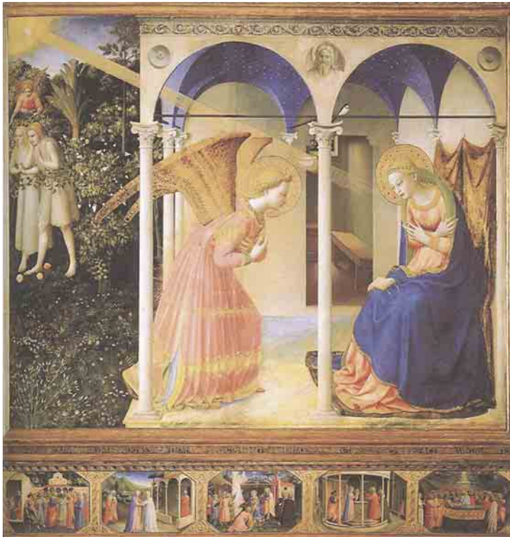
Fra Angelico L'Annonciation , 1430-32 Tempéra sur bois, 154 x 194 cm Madrid, Musée du Prado