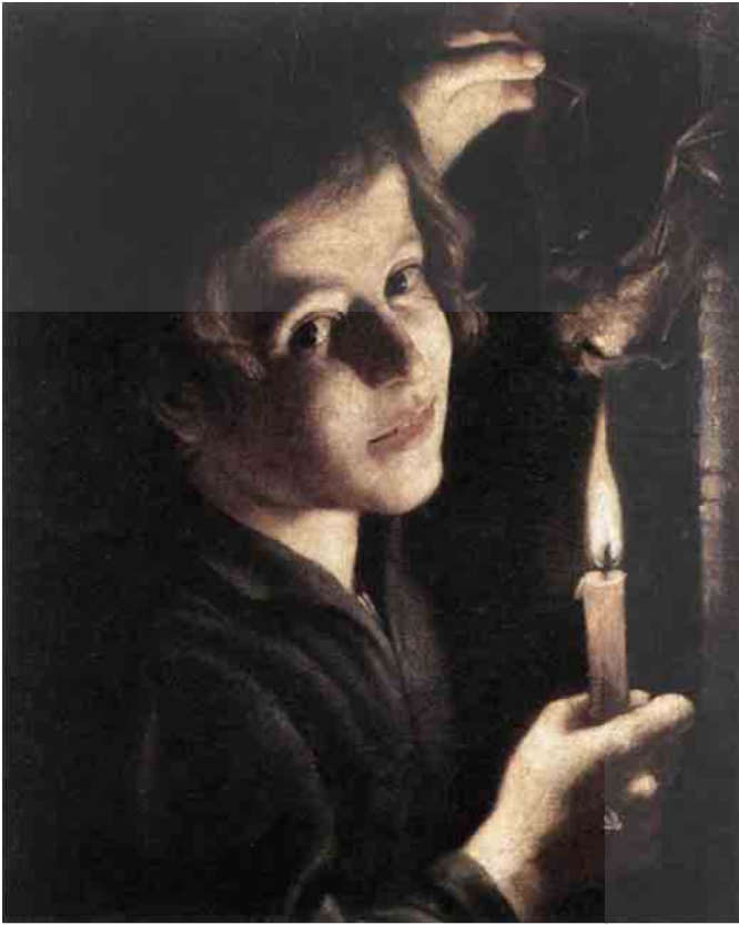
Trophime Bigot, Garçon brûlant les ailes d'une chauve-souris , vers 1635, huile sur toile, 45 x 39 cm Rome, Galleria Doria-Pamphili