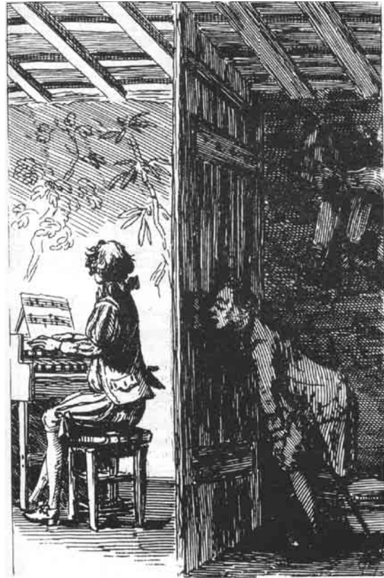
Illustration pour Le Diable amoureux Édition originale, Paris, Le Jay, 1772

Cette qualité de regard se retrouve presque naturellement dans l'utilisation généralisée de l'oxymore dont on a pu voir qu'il constituait l'un des procédés médiateurs les plus puissants du fantastique. Le décor privilégié du conte traduit visuellement la conjonction de ces forces contraires élémentaires que sont la lumière et les ténèbres. Des Nachtstücke de Hoffmann à Saint-Judas-de-la-Nuit de Jean Ray en passant par Gaspard de la Nuit , Nocturnal de Franz Hellens ou même les Poèmes nocturnes , titre que Baudelaire envisagea un instant de donner à son Spleen de Paris 45 , les jeux du clair-obscur conviennent aussi bien au poème en prose qu'au conte fantastique. Or s'il en va de la sorte, c'est bien parce que l'œuvre s'inscrit dans une tradition picturale qui se plaît à représenter l'obscurité à travers une série de contrastes d'ombres et de lumières. C'est ainsi qu'en plein XVIII e siècle une étonnante composition de Trophime Bigot, dans laquelle un jeune garçon au visage angélique brûle les ailes d'une chauve-souris censément diabolique, contient déjà en puissance tout ce qui deviendra le principe même de la lumière fantastique, depuis les effets bien connus du soleil nocturne de Gautier, jusqu'aux lumineuses ténèbres qui président à l'effondrement de la Maison Usher. De façon très significative d'ailleurs, c'est à une forme de médiation de l'ombre et de la lumière que s'attarde Cazotte dans son commentaire aux gravures du Diable amoureux :