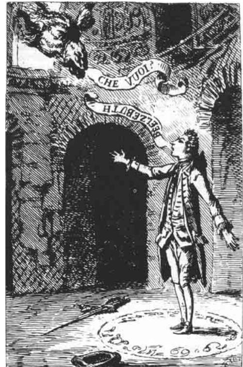
Illustration pour Le Diable amoureux Édition originale, Paris, Le Jay 1772