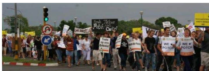
Figure 1 : Marche de protestation en octobre 2006 réunissant plusieurs milliers de personnes (5 000 d'après les organisateurs) contre le changement de nom de Potchefstroom en Tlokwe.

La formule initiale de double dénomination : nom ancien européen pour la localité urbaine et nom nouveau africain pour la municipalité, va finir par laisser place à de féroces batailles pour imposer le nouveau nom à la ville ou pour obtenir son maintien. Les cas de Pretoria/Tshwane et de Potchefstroom/Tlokwe illustrent ces combats farouches.