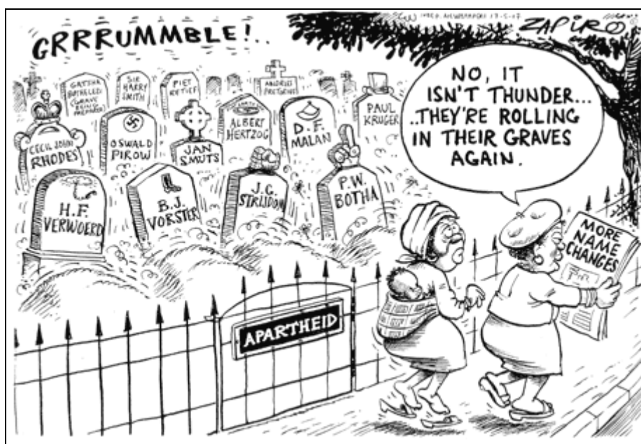
Figure 2 : La revanche toponymique. Caricature de Zapiro, Mail & Guardian , 17 mai 2007. Les architectes de l'apartheid et leurs prédécesseurs ségrégationnistes se retournent dans leur tombe au vu des changements toponymiques.

La néotoponymie s'inscrit dans une politique post-apartheid globale de réparation des exactions du passé qui comprend des réparations « matérielles » 17 (individuelles et collectives) et la construction de monuments ainsi que tout un ensemble de réparations symboliques (Commission Vérité et Réconciliation, nouveaux drapeau et hymne national, nouveaux jours fériés ou transformation de la signification des jours fériés existants...). Le coût économique non négligeable de ces réparations symboliques ne doit pas être considéré, selon le gouvernement, comme un élément restrictif : « Deputy President Zuma, referring to the national flag in a Heritage Day speech [in 2003], said, 'One could argue that the design is not cost-effective, but our objectives were greater than the merely economic' » (Jenkins, 2003 : 14). D'une certaine façon, les changements toponymiques, au même titre que toutes les autres transformations symboliques en cours, sont une empreinte a minima que doit imprimer le nouveau gouvernement sur un territoire national qui reste encore fortement marqué par des inégalités socio-spatiales héritées.