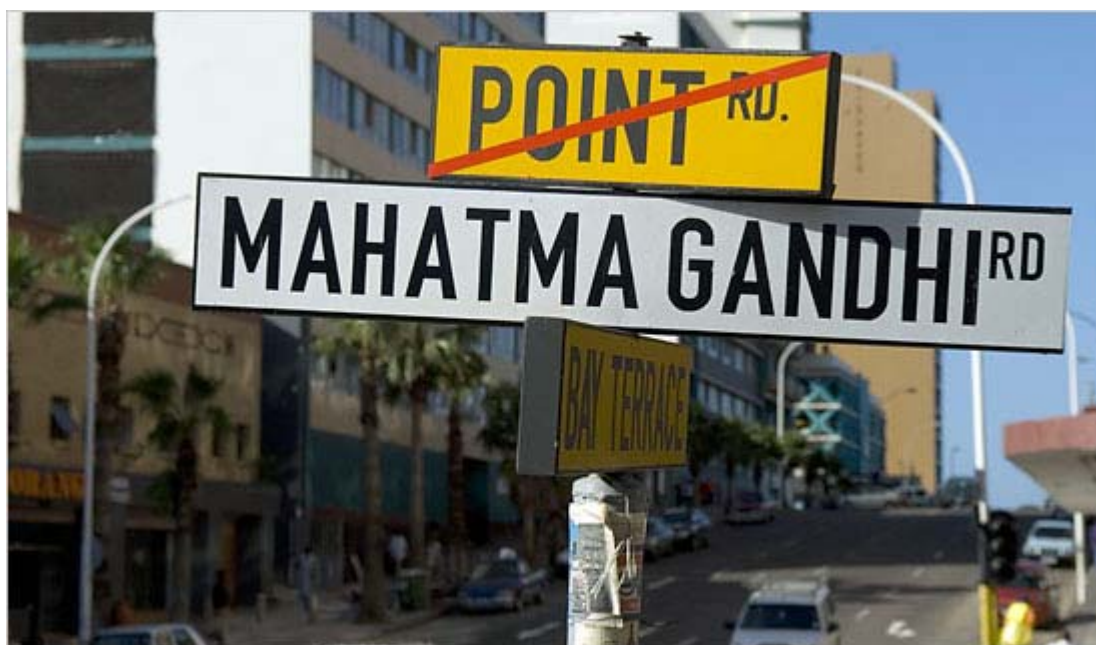
Figure 3 : Panneaux de rues indiquant le changement toponymique à Durban.