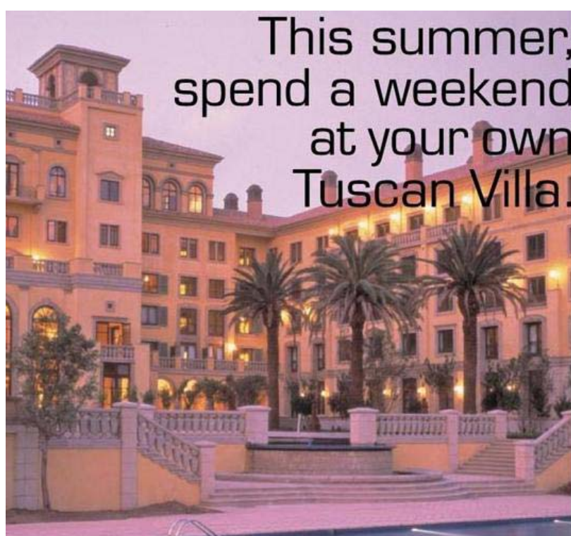
Figure 5 : Montecasino à Johannesburg.

aussi bien à l'échelle nationale qu'à l'étranger. De MonteCasino (Johannesburg) à Century City (Le Cap), de Sandton City (Johannesburg) à Gateway (Durban), de Green Acres (Port-Elizabeth) à Mimosa Mall (Bloemfontein), les toponymes de ces nouveaux espaces dans la ville révèlent que ces morceaux de territoire sont très ancrés dans la mondialisation et demeurent attachés à des référents internationaux. On peut prendre l'exemple de Montecasino (photo 1), à Johannesburg, qui reconstitue une ville médiévale italienne (de style toscan) pour abriter un casino (jeu de mot avec la cité perchée de Campanie) et une zone de restaurants et de loisirs. On utilise l'Italie comme modèle de l'urbanité de simulacre (Guillaume, 2001). Aucun détail n'a été laissé de côté car l'usure des pierres est respectée, le linge pend aux fenêtres et même les vespas sont accrochées aux poteaux. Ce complexe est la preuve que ses concepteurs souhaitent récupérer une histoire exogène (qui leur fait défaut) mais replacée dans une temporalité tout à fait contemporaine et fréquentée par une population racialement mixte.