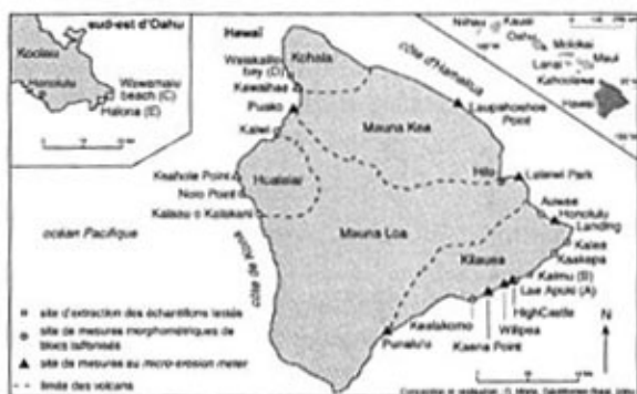
Fig. 1 - Localisation des sites étudiés

A cette approche naturaliste d'observation des formes et d'interprétation en terme de processus, nous avons adjoint diverses techniques ayant pour but de préciser les modalités d'action de la corrosion littorale sur les littoraux volcaniques et le rôle relatif des différents paramètres, qu'ils soient externes ou internes à la roche.