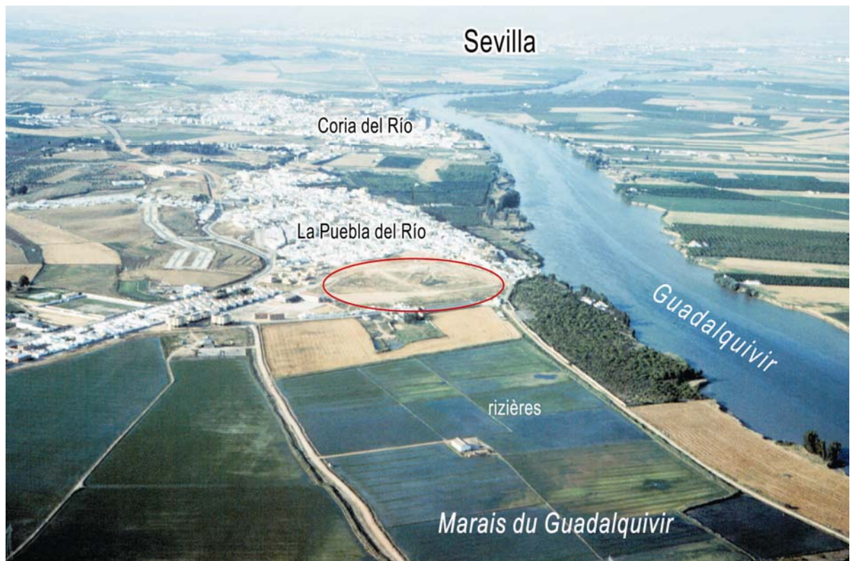
Importance stratégique des sites estuariens. La Puebla del Río (site archéologique de la Estacada de Alfaro avant son urbanisation, cercle rouge) et Coria del Río (antique Caura) au contact de la vallée du Bas-Guadalquivir et des marais éponymes.