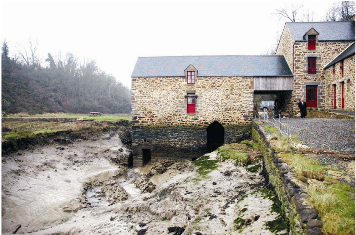
Relation patrimoine culturel / environnement estuarien. Le moulin à marée du Prat (La Vicomté-sur-Rance, estuaire de la Rance). La mise en valeur doit prendre en compte de l'envasement du site.

naturel, car dépendant de l'énergie marémotrice, industriel et architectural de premier ordre pour le littoral atlantique européen. Un projet communautaire (programme Culture 2000), auquel nous avons participé (2004-2005), a permis de formuler plusieurs propositions générales concernant leur protection et gestion. Intitulé « Moinhos de maré do Occidente europeu : valorização do património natural e cultural enquanto recurso de desenvolvimento » (Moulins à marée de l'Europe occidentale : valorisation d'un patrimoine naturel et culturel comme ressource de développement), ce projet était piloté par l'écomusée de Seixal (Portugal), commune de l'estuaire du Tage où subsiste une trentaine de moulins.