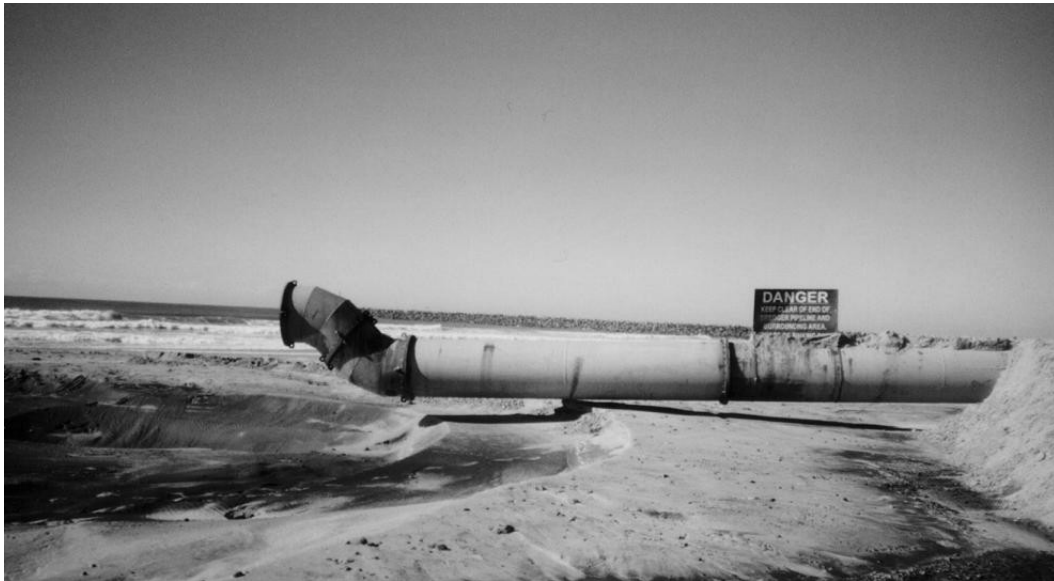
Figure 2 : Exutoire de la conduite de dragage qui ramène sur la plage publique d'Alkanstrand les eaux polluées et sablonneuses de l'entrée du port. En raison de l'érosion très forte due aux digues portuaires piégeant la dérive littorale, cette conduite permet l'engraissement régulier de la plage. (cliché de l'auteur, février 2002).

technique pour compenser l'érosion accélérée. Le problème est que la conduite de dragage donne directement sur la plage.