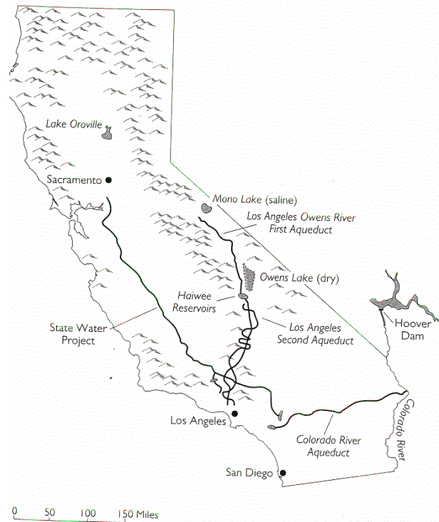
Figure 1: les sources d'eau de la Californie du Sud: un système interconnecté