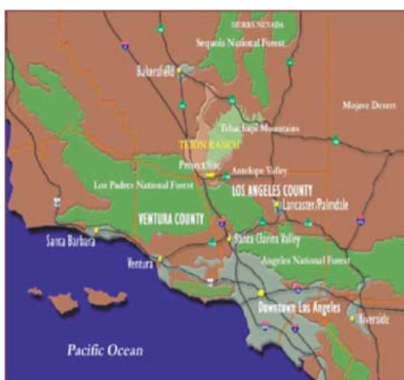
Figure 4: le projet immobilier Tejon Ranch, à la périphérie du comté de Los Angeles