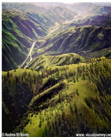
Figure 5: la localisation prévue de Tejon Ranch

Par ailleurs, des questions se posent quant aux ressources en eau dont disposent les actuelles zones de forte croissance dans la métropole. Cette croissance se fait dans des lotissements, qui, bien qu'ils se réclament de critères de densité et de conception intégrée des usages des sols, n'en sont pas moins qualifiés d'étalement urbain par certains, du fait de leur construction sur des terrains « vierges »