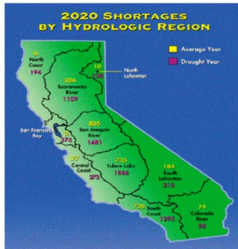
Figure 3: les pénuries attendues, par région.

Avec la combinaison de ces menaces, la Californie du Sud pourrait perdre assez d'eau pour dix millions d'habitants.