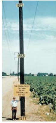
Figure 2: la subsidence des terrains, un des effets de la supexploitation des aquifères.