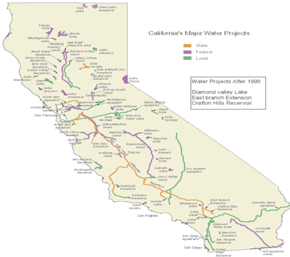
Figure 3: "Le plus grand bassin versant artificiel du monde"