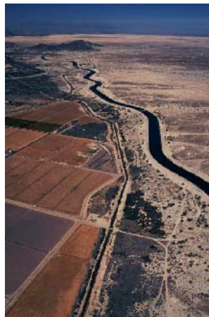
Figure 2: L' All American Canal