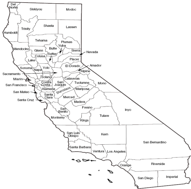
Figure B.1—California's Counties