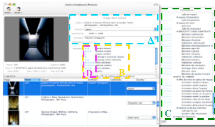
Figure 1. Saisie d'écran de l'interface « iMage » représentant les données informationnelles « A », les index « B », le thésaurus « C » et la pondération « D »

Lors d'une requête, la mise en correspondance (calcul de similarité entre chaque image et la requête), donne pour chaque image un coefficient de similarité, qui permet de classer les images selon la pertinence qu'elles présentent pour l'utilisateur. Cette méthode permet également de naviguer sémantiquement dans une base de références imagées.