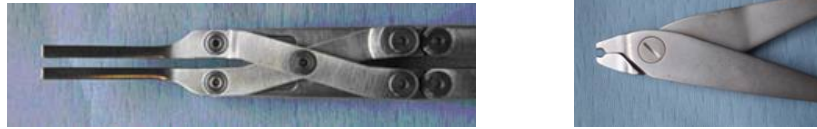
Figures 3. Photographie de deux outils utilisés pour l'étape de distraction lors de l'opération d'arthrodèse lombaire.

Cette organisation et cette mise en forme des faits relatant l'usage des outils par l'utilisateur nous paraissent indispensables à une bonne compréhension et une bonne représentation de son activité : nous ne pourrions proposer des solutions innovantes qu'en comprenant les besoins du chirurgien et donc en analysant minutieusement son activité – qui rappelons-le est difficilement verbalisable.