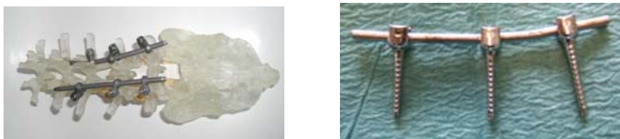
Figures 1. Ancillaire mis en place sur la colonne vertébrale du patient lors de l'opération d'arthrodèse lombaire.

Cette intervention est très traumatisante pour le patient et les contraintes postopératoires sont très douloureuses (notamment à cause du décollement des muscles vertébraux) et handicapantes (anesthésie totale de longue durée, long séjour à l'hôpital, nombreuses semaines d'arrêt de travail, etc.). Cette opération nécessite en effet une incision conséquente (25 centimètres de long) dans le bas du dos du patient et la mise en place d'un appareillage lourd de redressement de la colonne vertébrale (figures 1).