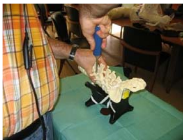
Figures 4. Photographies de la mise en place des vis pédiculaires dans la colonne fracturée

En ce qui concerne la préparation du scénario, nous avons décidé en accord avec le chirurgien, de nous placer à une certaine étape de la nouvelle procédure opératoire établie. De cette manière, le scénario a permis de tester surtout le prototype d'outil proposé. Cette décision de scénario a impliqué une préparation particulière du mannequin, notamment le pré-positionnement de vis dans les pédicules (figure 4).