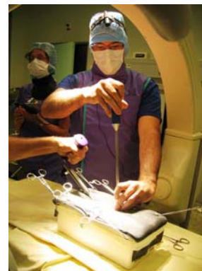
Figure 5. (à gauche) Le repérage de l'épineuse et incision de la peau du patient.