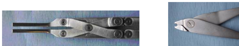
Figures 3. Photographie de deux outils utilisés pour l'étape de distraction lors de l'opération d'arthrodèse lombaire.

Cette organisation et cette mise en forme des faits relatant l'usage des outils par l'utilisateur nous paraissent indispensables à une bonne compréhension et une bonne représentation de son activité : nous ne pourrions proposer des solutions innovantes qu'en comprenant les besoins du chirurgien et donc en analysant minutieusement son activité – qui rappelons-le est difficilement verbalisable.