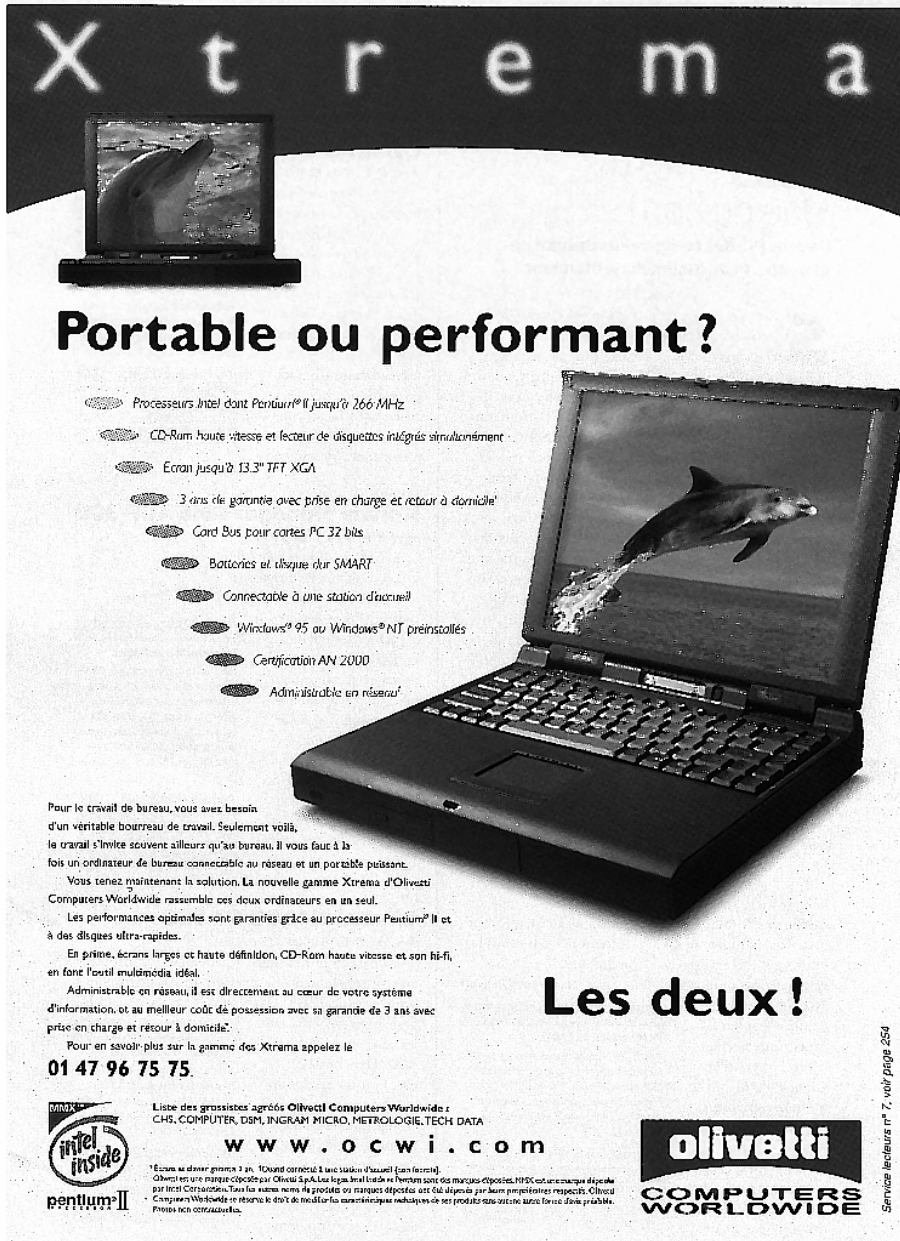
Illustration 4. Olivetti. « Portable ou performant ? Les deux ! » (Sciences et Vie Micro, n° 160, mai 1998, p. 191).

La première question (savoir quel produit vendre) consiste à choisir son marché, à se situer comme concurrent, à proposer son produit comme alternative à des produits similaires — jouer la carte du mimétisme pour élargir l'éventail du choix. La seconde question (savoir comment vendre le produit) revient, au contraire, à se positionner par rapport à la concurrence, à singulariser son offre selon telle et telle caractéristiques — jouer la carte de la différenciation pour emporter la décision. Comme l'a magnifiquement montré Jean-Marc Pointet, le problème du producteur consiste ainsi à trouver la meilleure combinaison possible entre différenciation et mimétisme :