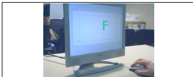
Figure 3 : Une lettre 3D, en coupe 2D, de face depuis la GUI.

Le premier exercice consistait à réaliser une série de six coupes à des coordonnées précises, et le deuxième à reconnaître, à l'aide de coupes 2D, une forme géométrique 3D (une lettre de l'alphabet, voir Figure 3 ) cachée dans un cube constituant un bloc opaque.