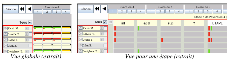
Figure 4. Extraits de l'interface de suivi de la classe pour un « questionnaire »

séance, le tuteur peut observer la validité (barre de validation verte/rouge) des réponses données par chacun à chaque QCM (étape) de l'exercice ; il peut également obtenir la justification saisie par un élève en survolant la barre de validation correspondante (orange car aucune évaluation de la justification n'est faite automatiquement). Les petits traits présents sous les barres de validation indiquent ici le nombre de fois où l'élève a répondu au QCM, leur couleur précise la validité des réponses successives.