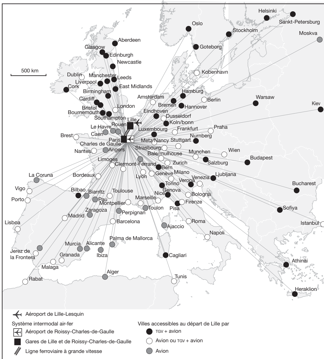
Fig. 4 Carte synthétique des destinations accessibles au départ de Lille en avion ou en TGV

L'effet de l'introduction de l'offre ferroviaire articulée à l'aérien à Roissy-Charles-de-Gaulle consiste d'abord en une extension spatiale de la desserte, qui rend accessibles notamment la Grande-Bretagne et l'Est de l'Europe. Pour autant, l'aéroport de Lesquin conserve sa pertinence pour l'accessibilité lilloise vers un grand nombre de villes françaises. Cela signifie que, dans l'état actuel, l'articulation TGV-avion via Roissy-Charles-de-Gaulle n'est pas totalement substituable à l'offre aérienne lilloise. Chaque configuration modale possède un espace de pertinence propre. Autrement dit, du point de vue lillois, les deux plates-formes aéroportuaires de Roissy et de Lesquin apparaissent comme complémentaires.