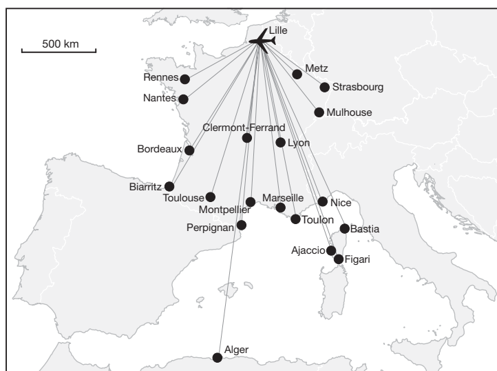
Fig. 1 Une vision monomodale de l'accessibilité lilloise, l'offre aérienne au départ de Lille-Lesquin en 2002