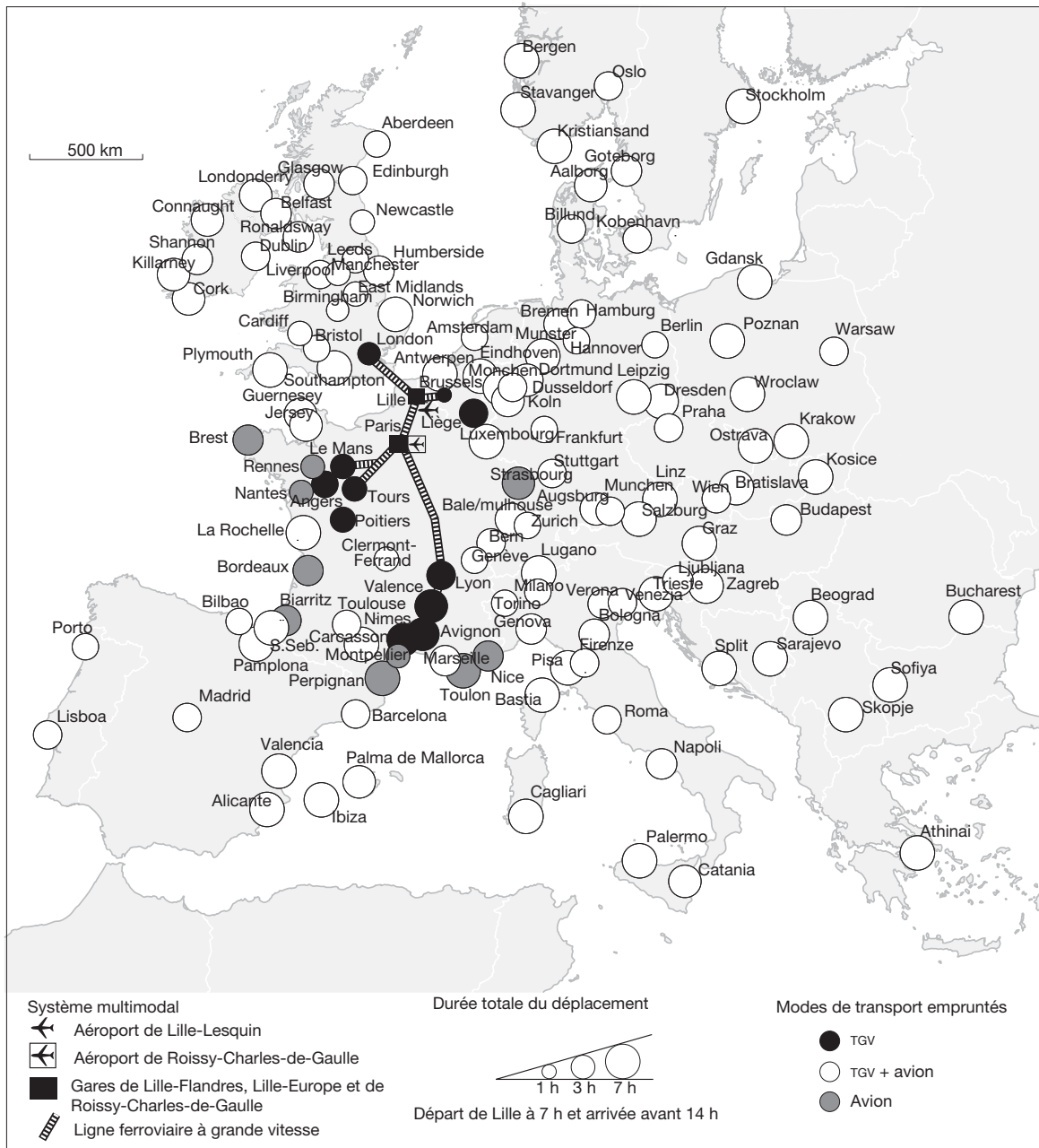
Fig. 5 Accessibilité multimodale lilloise pour un départ à 7 h