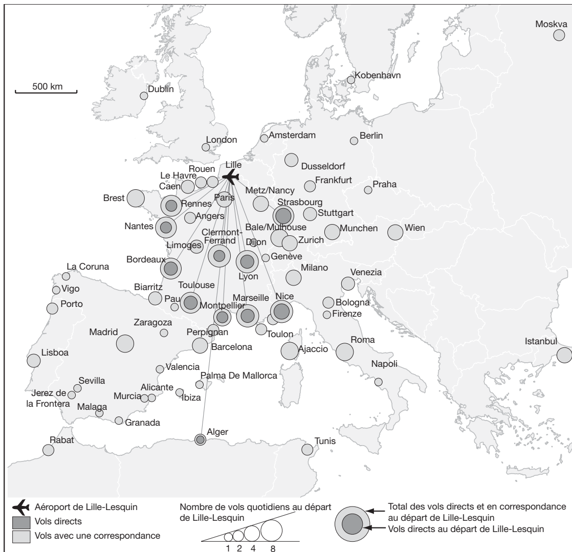
Fig. 2 Offre aérienne au départ de l'aéroport de Lille-Lesquin en mars 2003

Le premier enseignement de cette carte est de montrer que seule une partie limitée du continent est accessible au départ de Lille en avion. On observe la faible part des vols directs, avec onze destinations sur un total de quarante-sept proposées. De plus, parmi ces onze vols directs un seul dépasse les frontières nationales (vers Madrid). Les autres destinations européennes, vingt-quatre au total, ne sont accessibles qu'avec correspondance. On constate également la faible part des dessertes vers le Nord et l'Est de l'Europe. L'accessibilité aérienne lilloise est donc bien de nature essentiellement nationale.