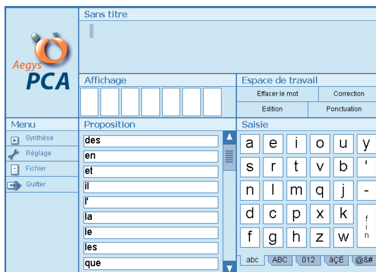
Figure 1 Interface pour le mode orthographique