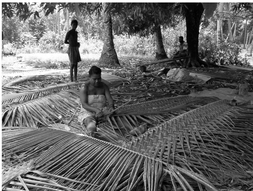
Figure 3 : Fabrication de nattes en feuilles de cocotier. Ambrym, Vanuatu

Le tableau 3 détaille les différents usages et produits tirés du cocotier recensés au Vanuatu. Outre l'importance du coprah dans l'économie du ménage, le cocotier est consommé quotidiennement pour son eau ou le lait extrait de l'albumen des noix mures. Ses feuilles sont utilisées pour les murs et toits des abris de jardin ou tressées en nattes ( figure 3 ). Au-delà de ces usages domestiques, des noix peuvent être offertes lors d'une cérémonie de mariage. L'eau de coco peut être utilisée comme excipient pour la préparation de plantes médicinales ou en association à des pratiques magiques.