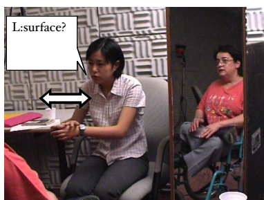
V+G = verbal avec geste

Ainsi, l'activité d'internalisation de la norme linguistique dans la pensée de l'apprenant passe par un processus complexe. Toutefois, les arguments avancés jusqu'ici ne portent que sur des exemples simples. L'examen de ces variations sera donc nécessaire. Pour la clarté de la discussion, nous abordons distinctement les variations et du côté apprenant et du côté natif. Le premier type de variation concerne la réaction de l'apprenant à la proposition du natif. Il a été avancé que l'accompagnement gestuel est souvent absent lors de l'internalisation, mais dans certains cas, l'apprenant produit l'énoncé avec un geste.