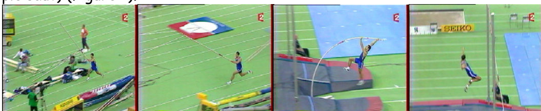
Fig. 1 Exemple de saut à la perche.

Pour illustrer notre propos, nous présentons une application qui consiste à reconnaître le type de saut dans une séquence d'athlétisme (saut en hauteur, à la perche, en longueur, ou triple saut) (Figure 1).