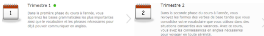
Figure 2. Répartition des modules par trimestre dans Babbel

Un autre élément en matière de structuration de contenus – trace de l'adaptation progressive des instances conceptrices des communautés aux besoins réels ou envisagés de leurs membres – mérite d'être signalé. Depuis décembre 2010, Babbel propose une nouvelle répartition par trimestre de ses modules pédagogiques. Il ne s'agit pas de nouveaux contenus mais d'une redistribution des anciens sur une année (en modules trimestriels) faite dans un souci d'accompagnement de l'utilisateur à travers les étapes de son apprentissage :