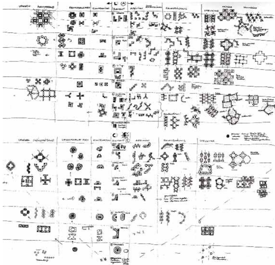
Ungers, Extrait d'un lexique morphologique incomplet, basé sur les formes géométriques fondamentales et sur leurs dérivations, dans Architecture comme thème .

pas en tant qu'imitation de l'existant cependant, mais dans le sens d'une interprétation de ce qui est le produit aussi bien du hasard que d'une création intentionnelle. Il ne s'agit pas, dans le cas de cette adaptation à la situation, de singer un style, ou d'un facsimilé de la réalité; mais il s'agit de l'exégèse conceptuelle de ce qui était déjà là, de la création continuée de l'existant. Le thème de l'assimilation est ainsi saisi comme un principe producteur, qui élargit les