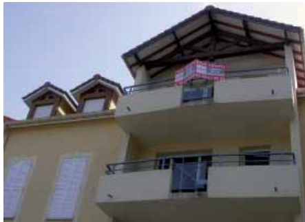
Toiture « villa basque ».

de fabrication de toute possibilité de relation physique avec le passé du territoire où ils sont inscrits. Ils donnent lieu à des associations purement imaginaires. Ils existeront alors fantasmatiquement au titre de traces futures d'un passé rêvé. Ces « traces à venir » prennent place, en l'occurrence, au côté d'autres détails fantasmatiques, ceux-là mieux identifiables comme tels, car beaucoup plus immédiatement perceptibles comme étrangers au territoire physique qui les accueille: ce sont les toits gallo-romains, balcons basques ou terrasses versaillaises qui abondent eux aussi dans le paysage.