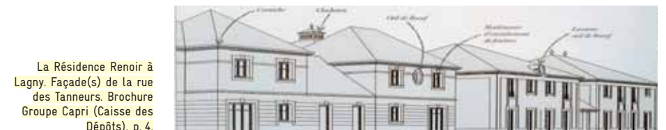
La Résidence Renoir à Lagny. Façade(s) de la rue des Tanneurs. Brochure Groupe Capri (Caisse des Dépôts), p. 4.

47. Signalons dans la liste des styles: Briard, Crystal Palace, Passage parisien, Haussmann, Nouvelle Athènes, Cottage, Ranch, New York, Nouveau Mexique. Ranch, New York et Nouveau Mexique sont cantonnés aux hôtels, pourvoyeurs de destinations exotiques. Les habitations monopolisent l'aspect « Paris capitale du (premier) xix e siècle ». La multiplicité des références est d'ordre programmatique, comme le confirme B. Durand-Rival: « À Val d'Europe, nous avons cherché à varier les références (...) Disons que l'architecture du Vd'E est référencée, qu'elle mobilise un système de références. » Voir