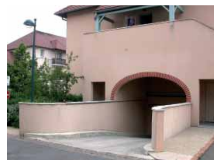
Sortie de parking souterrain à l'arrière du « corps de ferme ».

Mais cette substitution d'apparence fonctionnelle reste essentiellement symbolique, et superficielle: délibérée et fictive 56 . Le garage a de fait cessé de ressembler à l'écurie, comme l'indique, bon gré mal gré, la sortie du parking souterrain placé sous les appartements du principal « corps de ferme ».