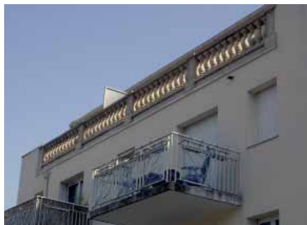
Rambarde de terrasse « Versailles ».