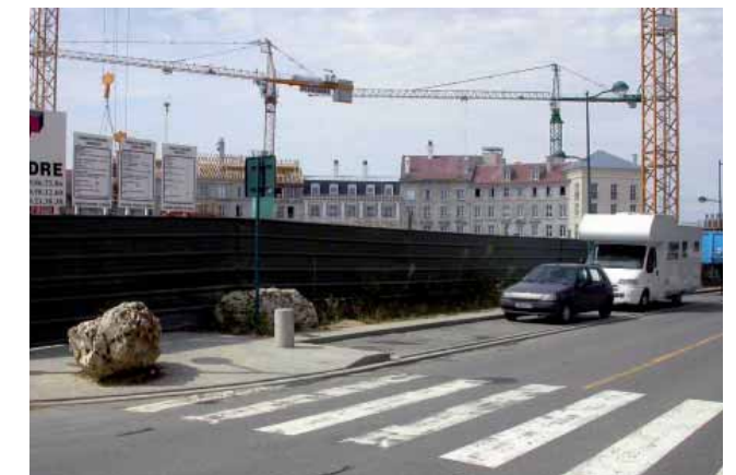
La place de Toscane en construction, depuis le cours de la Garonne, juillet 2005.

Le phénomène est accentué par le caractère disparate des références. Cette réalisation « d'inspiration italienne » assemble en effet divers styles d'immeubles urbains européens du XVIII e et du XIX e siècles 50 . Leur mise à l'échelle, qui donne à l'ensemble l'aspect d'une maquette légèrement inférieure à l'échelle 1/1, produit à elle seule un effet de décor prononcé. Ce ne sont d'ailleurs pas tant des édifices « italiens » qui entourent la fontaine « romaine » censée fournir son ancrage à la place (malgré sa position légèrement excentrée dans l'ellipse), que des façades néoclassiques ou pré-haussmaniennes de synthèse. Sans jamais citer de bâtiments précis, elles ramènent à Londres, Paris, ou autrefois Berlin, aussi bien qu'à Rome ou à Parme. Cet éclectisme affirmé 51 donne à la place son irréalité – auquel son nom de Toscane ajoute une touche supplémentaire d'arbitraire. Hormis un passage « giottesque » engoncé entre deux autres maisons de ville, qui ne déparerait pas les fresques franciscaines d'Assise, aucun des bâtiments édifiés n'évoque à proprement parler l'architecture toscane de la Renaissance, pourtant censée cautionner ce choix de nom. Mais peut-être est-il ici plutôt question de la Toscane du XIX e siècle,