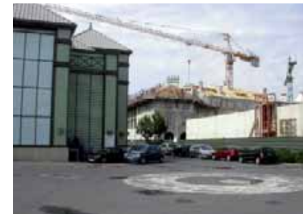
La place de Toscane en construction, vue depuis le centre commercial, juillet 2005.

48. Prise au sérieux, elle relèverait de cette culture des classes moyennes qui, selon Venturi, commande aujourd'hui la réalité de l'architecture et de l'urbanisme contemporains, et qu'illustrent avec abondance les brochures immobilières et sites internet étudiés par G. Morel Journal. Voir ici même « La visite du domaine ». Cette thématique croise le beau travail plastique effectué par A. Bublex, toujours dans ces pages, avec ses « Levés » qui sont autant de « Prescriptions architecturales à Bailly-Romainvilliers: tentatives de restitution rétroactives ». Il est tout sauf indifférent qu'il ait cru devoir user, pour présenter les résultats de son enquête, de ce type de technique graphique, où convergent néoclassicisme linéaire, tracé d'architecture et « ligne claire » de BD.