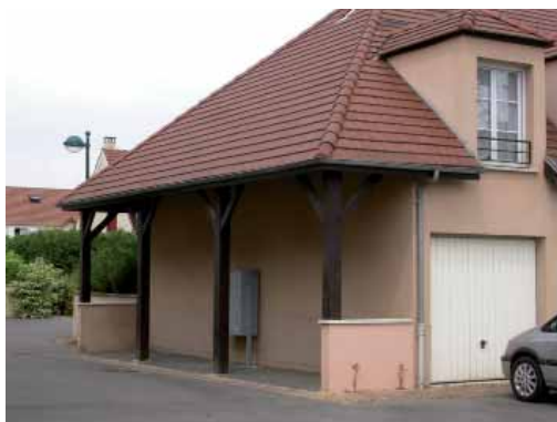
Abreuvoir-mangeoire: boîtes aux lettres « briardes ».

Les façades ne sont pas ici seules en cause. Loin de la monumentalité des places et des « styles » qu'elles appellent, les immeubles d'habitation répandus alentour étendent la logique parodique qui préside à la conception de la ville 54 . On s'intéressera de ce point de vue (en oubliant momentanément qu'il voisine aussi bien avec des détails empruntés aux villas basques ou aux toits « gallo-romains » lyonnais), au style « briard », le plus immédiatement susceptible d'incarner une authentique « thématization » ungerienne, avec sa prétention à l'enracinement à la fois géographique et historique. Même là en effet, on a affaire à une sorte de decorated shed augmenté, et à la « rhétorique de l'appliqué ». Les volumes et formes citent les grandes fermes briardes des environs, tout en installant dans leur intérieur des appartements de ville de taille standardisée (mais déclinée en termes « historiques » de maison de maître ou de métayer 55 ). Il y a là plus qu'un simple « façadisme ». Le lieu où était établi un abreuvoir ou une mangeoire, abrite maintenant la batterie de boîtes aux lettres, abreuvoir moderne d'information. Et les voitures occupent la place des chevaux.