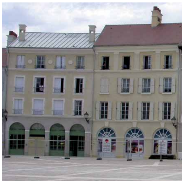
La place de Toscane: déjà habitée, encore en chantier, juin 2006.

entre l'État français et la compagnie Disney – dont Pierre Chabard analyse ailleurs avec finesse les effets 4 – intensifie, et rend dans cette mesure originaux, des traits repérables sous des formes plus diluées dans bien des développements récents. Malgré les apparences multipliées de la fugacité, un mode stable d'habitation et de construction d'un territoire est ici à l'œuvre – ou tout au moins la tentative de l'instaurer.