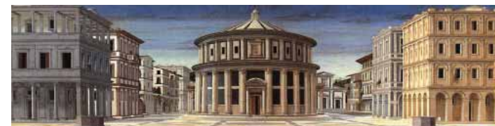
Luciano Laurana (?), Città ideale , Galerie nationale de la région des Marches, Urbino.

45. Ils offrent aussi un premier exemple de la « ligne claire » qui commande en général la réalisation visuelle des images « thématiques ». (Voir page suivante.)