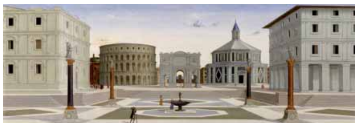
Lucio Laurana (?), Città ideale , Walters Art Museum, Baltimore.