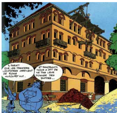
René Uderzo et Maurice Goscinny, Le Domaine des dieux , 1971.

I wrote about in [Complexity and Contradiction in Architecture]? » Voir R. Venturi & D. Scott Brown, Architecture as Signs and Systems For a Mannerist Time , op. cit., p. 8.