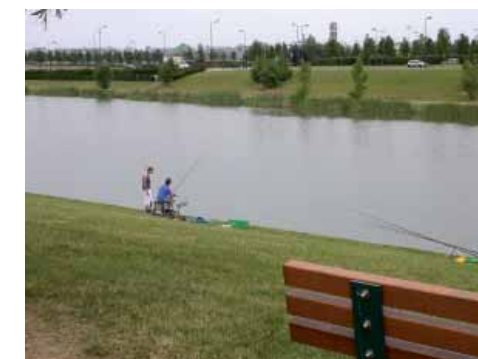
Le « clocher » du centre commercial de Val d'Europe, vu depuis le lac des Gassets à Serris.