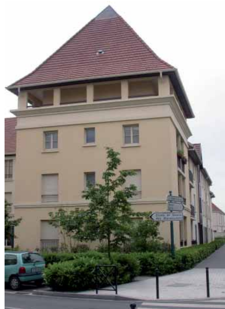
Toit « gallo-romain ».

Porteurs d'une « histoire » paradoxalement vague, car tissée de synthèses improbables, ils ont pour tâche d'évoquer un passé qu'ils ne convoquent jamais dans ses traces matérielles: cela obligerait à le doter d'une précision indésirable. Ce passé générique n'est pas sans rapports avec celui qu'évoque la « valeur d'ancienneté », jadis identifiée par Riegl comme un trait spécifiquement moderne. Lorsqu'une brochure de promoteur fait référence à une « architecture classique » – une nouvelle fois à partir de « détails » iconographiques identifiables comme tels (« modénatures », « corniches ») et de catégories générales (un improbable « équilibre des volumes » ou « travail sur la symétrie ») – pour désigner des bâtiments qui, par leurs volumes, par leurs couleurs, enfin par la coordination des « détails » iconographiques, ne rappellent aucun édifice historique susceptible d'autoriser l'usage de l'expression, c'est que le passé convoqué a cessé de s'identifier à un passé historique 57 . Il correspond bien davantage à la catégorie de l'ancien, et aux affects et valeurs propres qu'elle est censée convoquer.