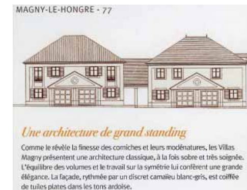
Détail de la Brochure Nexity pour Les Villas Magny.