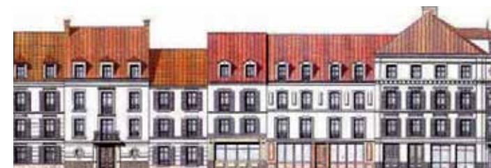
Détail de la brochure Nexity pour Les Villas Magny, à Magny-le-Hongre (hors secteur IV).