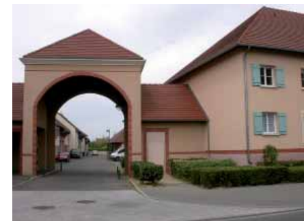
L'écurie et l'entrée de la « cour de ferme ».

discours marketing final se l'approprie, mais souvent ils préfèrent imaginer une autre histoire. » Voir infra , Annexe, « Une matinée... », loc. cit. Sur la différence entre la « représentation projective » moteur du projet et sa « représentation descriptive » en termes de marketing, voir supra P. Chabard, « L'asuburbia... », chapitre « Effectuer: la rhétorique de l'action ».