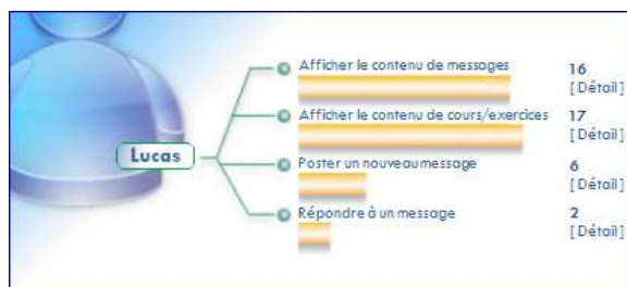
Figure 6. Indicateurs concernant le profil d'un utilisateur.

Sur la figure 4, chaque sphère représente une action de lecture d'un message par un utilisateur. Le diamètre de chaque sphère est proportionnel au temps passé par un utilisateur pour la lecture. La distance entre deux sphères représente le temps écoulé entre deux lectures. Une sphère peut être de quatre couleurs (orange, bleue, verte, ou grise). Une sphère verte signifie que l'utilisateur a ouvert un message en ayant bougé le « scrollbar » vertical vers le bas pour voir la totalité du message (on peut supposer dans ce cas que la lecture a été effectuée jusqu'à la fin du message, même si on laisse le soin à l'utilisateur d'interpréter cet indicateur). La sphère orange exprime le fait que l'utilisateur a seulement affiché le début du contenu du message sans toucher le « scrollbar ». La sphère bleue signifie que l'utilisateur a affiché le message, et qu'il a bougé le « scrollbar » mais sans aller jusqu'en bas (affichage partielle d'un message). Enfin, la sphère grise indique que l'utilisateur n'a fait qu'un passage éclair sur un message (moins de 3 secondes).