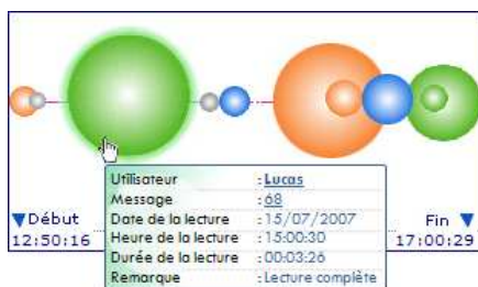
Figure 4. Indicateurs d'interaction de tous les utilisateurs qui ont effectué une activité « Lecture d'un message ».

est-ce que le message n'a été lu que partiellement, et (iii) pendant combien de temps le message a été lu.