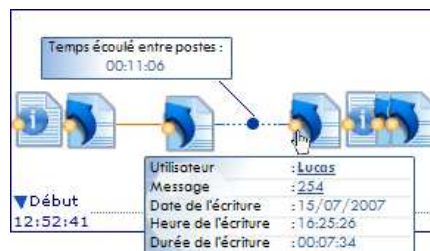
Figure 5. Indicateurs pour deux activités « Poster un nouveau message » et « Répondre à un message ».