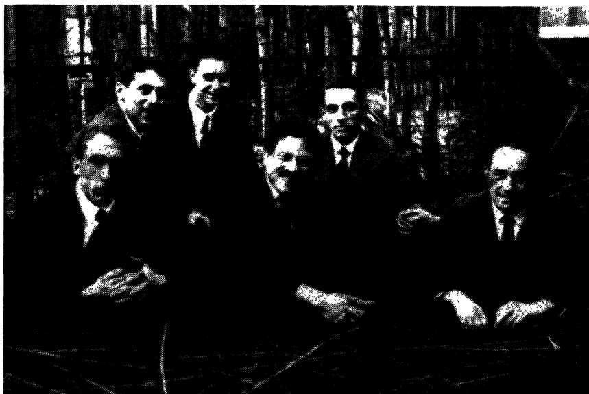
Photographie prise à Leiden en 1924

Peut-être la source la plus sûre pour l'histoire de la physique récente est-elle le recours à des lettres échangées entre physiciens, de préférence des lettres manuscrites. Celles-ci sont en général franches et dépourvues d'inhibition. Dès 1920, une lettre tapée à