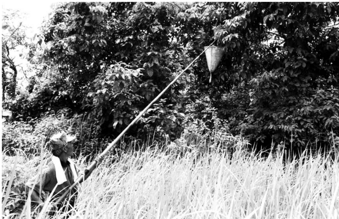
FIG. 3. – Les nids les plus hauts sont souvent difficilement accessibles.

La récolte se transforme en une épreuve douloureuse pour les collecteurs. Au cours de l'opération, des larves et des centaines de fourmis tombent à terre et dans la panique s'acharnent sur le collecteur 12 . Au sol, les fourmis s'activent à reprendre les larves et les nymphes dispersées. Elles retourneront rapidement dans l'arbre pour protéger leur progéniture dans les nids encore intacts, consolideront ceux éventrés par le collecteur avant d'en construire de nouveaux.