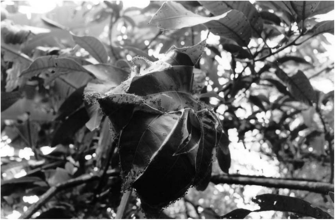
FIG. 1. – Nid de Oecophylla smaragdina.