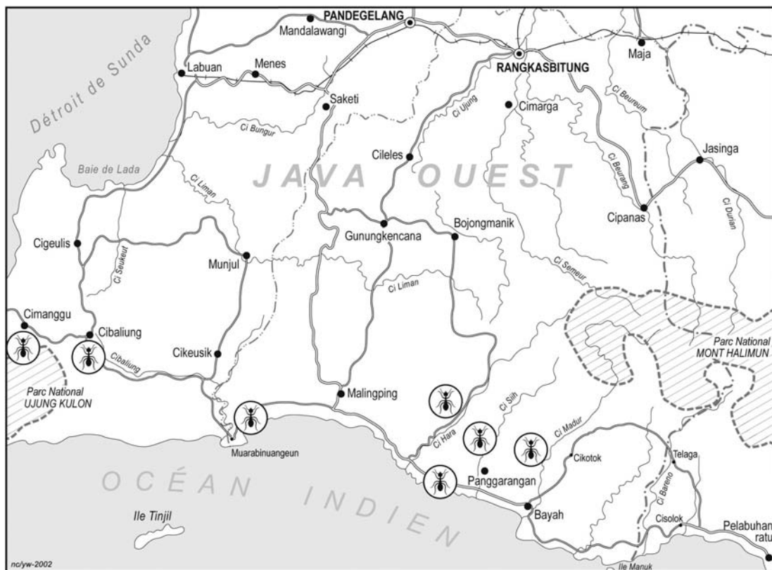
Fig. 2. – Sites de production du kroto de la région de Malingping (dessin Whayantono).

d'après-midi, en particulier lorsque la récolte des premières heures est jugée insuffisante. À la saison des pluies, les collecteurs attendront souvent que les nids se vident des eaux retenues pour reprendre la collecte. Le climat demeurant incertain, l'observation du ciel sur les sites de collecte donne cours à des spéculations incessantes entre collecteurs.