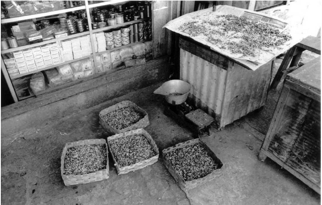
FIG. 5. – Un étal de commerçant. Fraîchement arrivé, le kroto sera pesé, puis disposé pour la vente.

conserve plus de six mois. Cinq kilogrammes de kroto frais donnent un kilogramme de kroto séché (soit une perte de poids de 80 %) ; le kroto utilisé est de mauvaise qualité, ancien, et comprend de nombreuses fourmis. La famille du collecteur prend en charge la transformation. Les larves et les fourmis sont bouillies pendant une heure avant d'être disposées à sécher de deux à trois jours. Le prix à la vente du kroto sec étant de moitié inférieur à celui du kroto frais, seuls les collecteurs qui ne veulent pas ou ne peuvent pas vendre quotidiennement leur récolte se tournent vers ce commerce, au demeurant localisé (dans la région de Sukabumi en particulier). Personne à Malingping ne semble avoir vendu du kroto sous cette forme. Plusieurs petites entreprises commer-