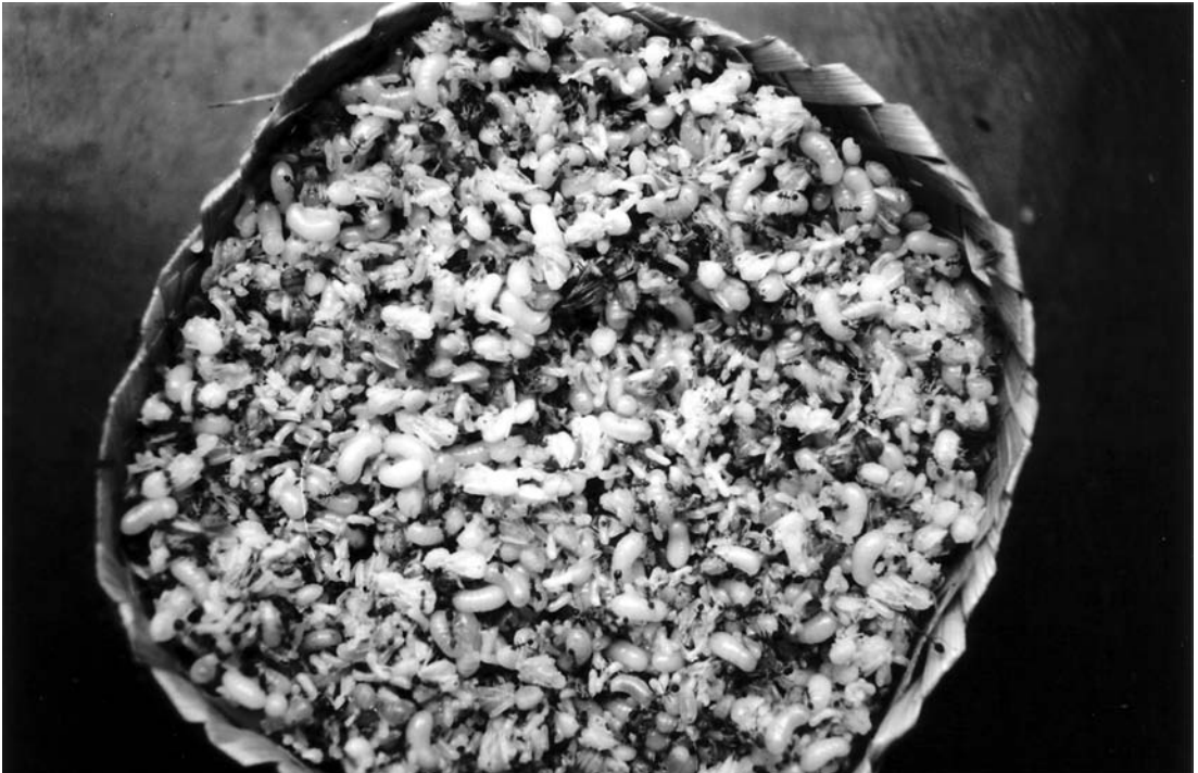
FIG. 4. – Un besek de kroto de qualité médiocre.

un jaune pâle. Cette détérioration rapide exige de trier encore une fois le kroto à Djakarta. Un dixième de la récolte convoyée peut être alors écarté. Par expérience, les collecteurs savent que les Oecophylla produisent moins de larves pendant les mois les plus chauds de l'année, mais des larves plus grosses (larves sexuées). Ce kroto se conserve plus longtemps que les larves de petite taille, mais est reconnu de qualité moindre.