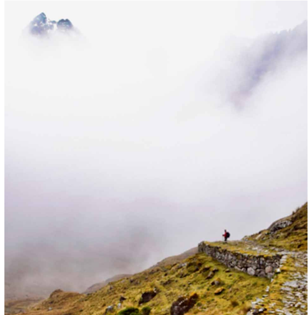
La adaptación al cambio climático requiere andar caminos que nos llevan a futuros inciertos (Sendero en la cordillera de Vilcabamba en los Andes peruanos.)

El primer mensaje ilustra cómo la restauración de la tierra puede combinar objetivos de adaptación con otros objetivos como medios de vida y desarrollo de capacidades en las comunidades. La restauración de la tierra puede reducir los riesgos en el futuro (por ejemplo, al proteger de peligros o amenazas) y la vulnerabilidad actual (por ejemplo, al diversificar los medios de vida). Un análisis del costo-beneficio de la restauración de manglares en Vietnam reveló los beneficios económicos de la extracción de madera, pesca y recolección de miel generados pocos años después de haberse llevado a cabo una restauración, y en el largo plazo, el ahorro en los costos de mantenimiento de infraestructura que brinda protección en la zona costera (Tri et al. 1998).