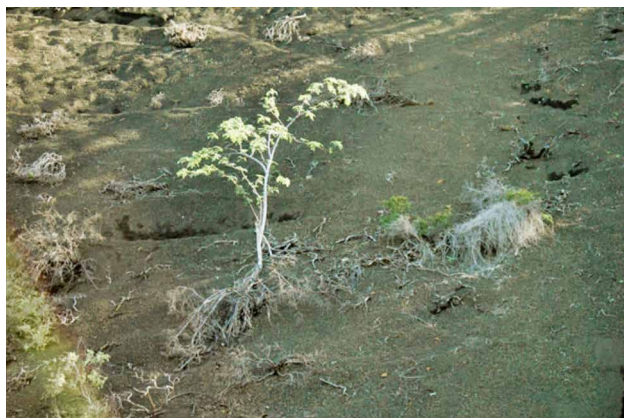
Las estrategias de restauración y adaptación encontrarán con mayor frecuencia nuevos ecosistemas que encierran en sí mismos cosas que desconocemos (Árbol en las Islas Galápagos, Ecuador.)

los ecosistemas. Los nuevos enfoques necesitan nuevos arreglos de gobernanza que puedan tomar en cuenta cómo los diferentes actores interpretan e implementan la restauración, especialmente en iniciativas locales generadas en la comunidad, así como sus motivaciones y expectativas. El primer paso para lograrlo consiste en crear un ambiente que permita la participación segura, activa e incluyente.