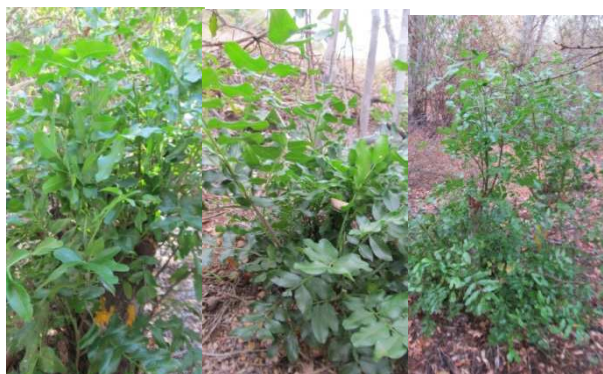
Figure 4 : Rejets secondaires après une année de coupe

La figure 4 montre la quantité d'écorces et de feuilles que peuvent fournir les rejets de C. grevei dit Katrafay Filo et Katrafay Dobo de diamètre moyen inférieur à 3 cm et de hauteurs respectives de 2.1 m et 2.7 m. On constate que la production en écorce est proportionnelle à la