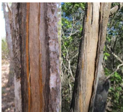
Figure 2 : Blessures partiellement cicatrisées