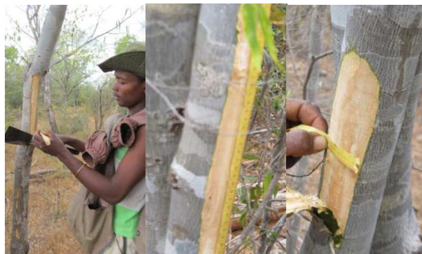
Figure 1 : Ecorçage de différentes bandelettes

Des rejets de souche ont été aussi traités. Des rejets primaires de souches sont de nouveau coupés et écorçés complètement. Les rejets secondaires apparus après une année de coupe sont évalués en nombre et en taille ainsi que l'état de recouvrement en écorce des surfaces écorçées pour les arbres étudiés.