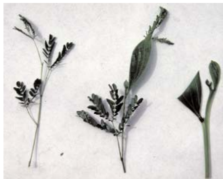
Feuilles d' Acacia mangium : transitions de la feuille bipennée au phyllode

L'écorce est claire, gris-brunâtre ou brune, rugueuse, fissurée longitudinalement.