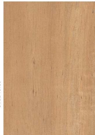
Bois de Acacia mangium

L'aubier est blanc crème à brun clair et le bois de cœur brun foncé. Le fil est droit mais les planches ont tendance à gauchir. Le bois n'est pas homogène : il est très léger au cœur (densité de 0,32) et léger vers l'extérieur (de 0,46 à 0,60) ; d'autant plus dense vers l'extérieur, semble-t-il, que l'arbre est âgé. Le retrait volumique est faible (8%). Les modules de rupture et d'élasticité sont faibles. La durabilité naturelle est faible et il nécessite un traitement de préservation.