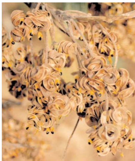
Fruits de Acacia mangium