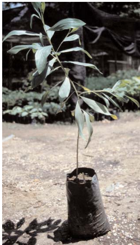
Plant de Acacia mangium

La productivité est de l'ordre de 20 m 3 /ha/an dans le Sud et de 7 à 10 m 3 /ha/an dans le Nord. Il est envisageable de produire du bois d'œuvre avec une révolution d'au moins 20 ans, dans les meilleures conditions climatiques de la zone forestière de Côte d'Ivoire.