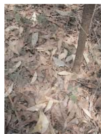
Litière sous Acacia mangium

En général, Acacia mangium est relativement peu attaqué par des maladies, sauf par endroits, la pourriture du cœur (pourridié). Dans le Nord de la Côte d'Ivoire, il est fortement parasité par des Thapinanthus qui entraînent assez