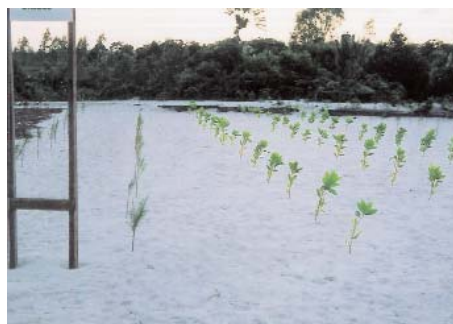
Plantation de Acacia mangium sur sable blanc

Les plants sont élevés classiquement en pépinière en semant deux graines pré-traitées par pot, sous un léger ombrage pendant la germination et les quelques jours qui suivent. Ensuite, ils sont élevés en pleine lumière, sans ombrière. La plantation a lieu à trois ou quatre mois avec des plants d'environ 30 cm. Les plants sont installés à des écartements de trois à quatre m pour obtenir une