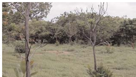
Jeunes anacardiers rejetant de souche après le passage du feu

En raison de son fort enracinement pivotant, l'anacardier est utilisé pour protéger les sols dégradés contre l'érosion.