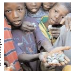
Enfants montrant des noix de cajou

La production mondiale de noix de cajou était estimée à un peu plus d'un million de tonnes en 2000 et 2001. L'Inde et l'Afrique assurent chacune environ un tiers de la production. Le reste se partage essentiellement entre le Brésil et le Viet-Nam. La moitié de la production mondiale est transformée en Inde.