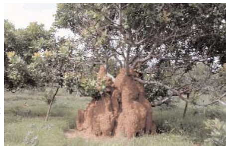
Anacardier en vie au milieu d'une termitière

Les rats mangent les noix tombées ou semées et les singes apprécient les pommes.