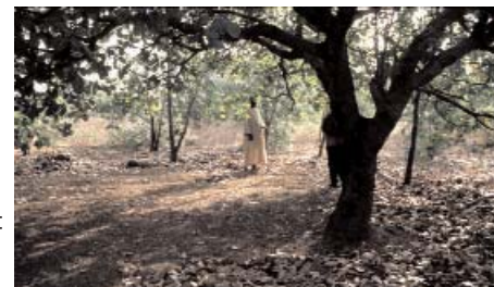
Agriculteur dégagant le sol sous anacardier pour faciliter le ramassage des noix de cajou

La récolte des noix s'effectue soit au sol, soit lorsque la pomme cajou est bien mûre. En effet, la noix atteint ses dimensions maximales avant que la pomme ne se développe. Pendant la maturation de la pomme, la noix se dessèche, perd du volume et durcit, ce qui permet ensuite sa conservation.