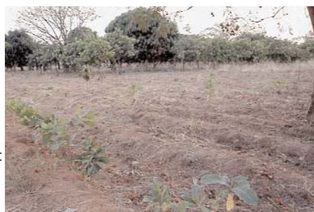
Haie-vive d'anacardiers installés par semis direct (Korhogo)

L'anacardier est aussi utilisé en haie fruitière de protection ou de délimitation de parcelles. L'installation se fait par semis direct : les graines sont semées en ligne avec un écartement de 50 cm environ.