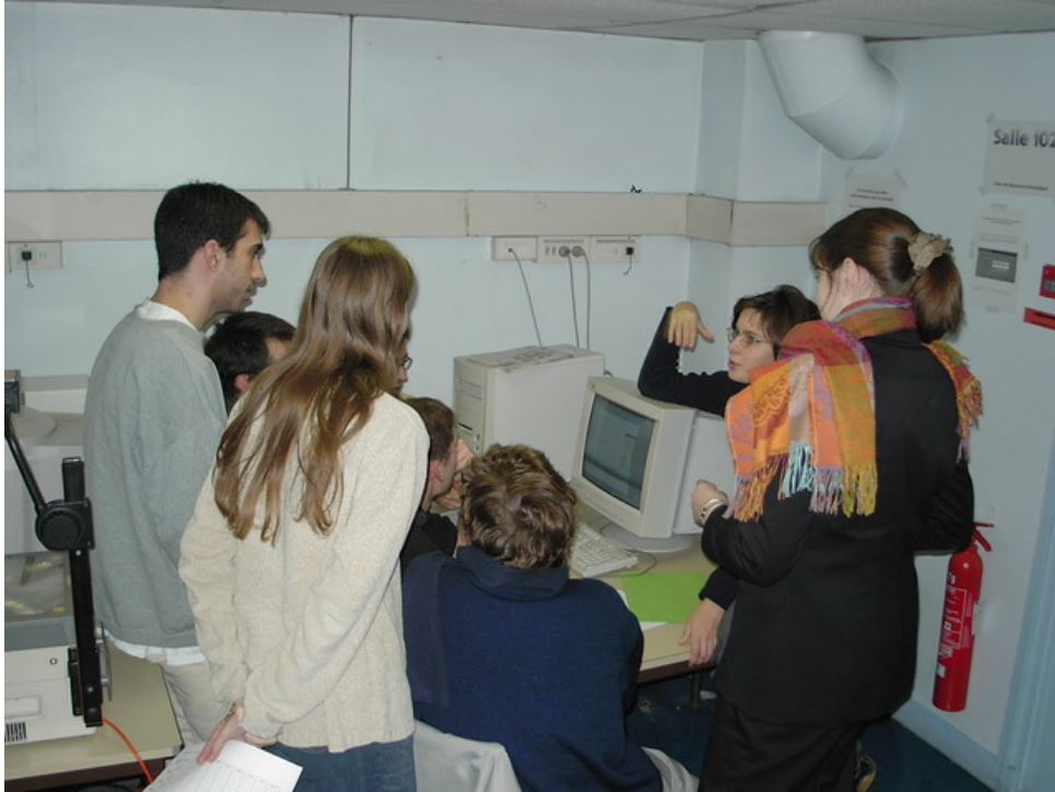
FIG. 3 – Phase de concertation entre les joueurs.