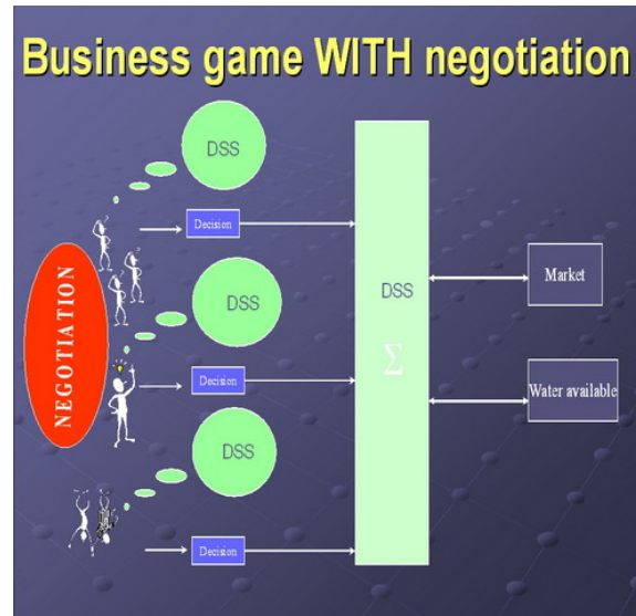
FIG. 2 – Phase 2 : jeu avec négociation.

systèmes de production agricole dans un territoire défini ayant des ressources limitées (en eau par exemple) et face à des marchés en évolution (marché local et marché de l'exportation). Actuellement ce jeu a une vocation pédagogique car il propose :