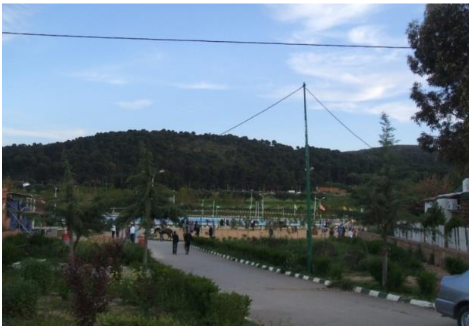
Photo. Plateau Lalla Setti : aire de jeux et de loisirs. Au second plan, peuplement de pin d'Alep, forêt de Tlemcen

essentiellement urbain qui serait le plus intéressé. L'aménagement effectué ces dernières années par un bureau d'études de la commune de Tlemcen tient surtout compte de la population urbaine et c'est une initiative bien réfléchie dans la mesure où la forêt ne doit pas être perçue seulement comme une masse occupant un espace donné mais comme ayant un impact sur les zones environnantes.