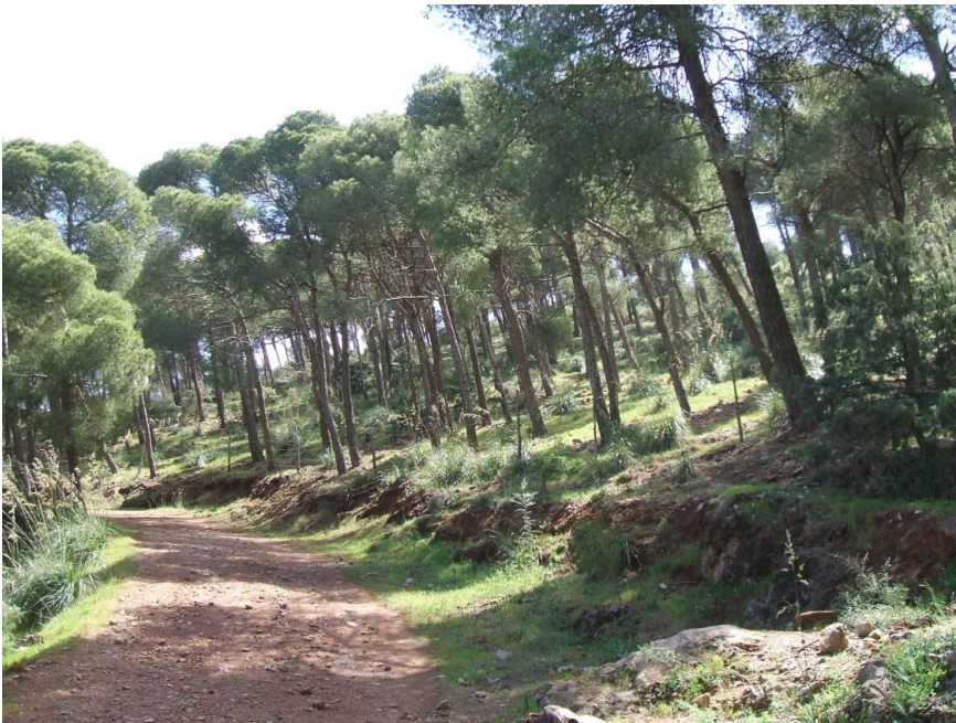
Photo. Aspect régulier du peuplement de pin d'Alep. Forêt de Tlemcen