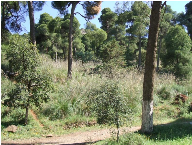
Photo3. Trouée avec pin d'Alep, chêne vert, genévrier et doum

C'est une forêt artificielle pure, composée essentiellement d'une seule essence, le pin d'Alep (on note la présence de quelques beaux sujets de cèdres). Cette vieille futaie présente un sous-bois peu abondant. Les principales espèces relevées sont le genévrier oxycèdre, le chêne vert, le chêne zen, l'asperge, le genet épineux, le doum, le palmier nain, l'asphodèle, le romarin et le ciste.