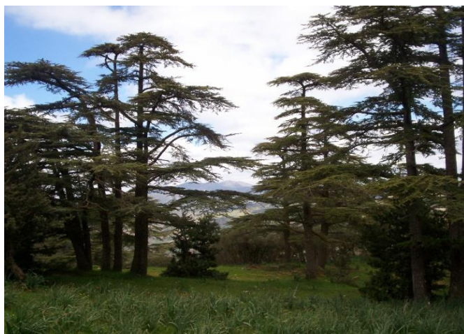
Photo 2..Cédraie de Tissemsilt, parc national de Theniet el had. Très beau paysage à reproduire dans la région de Tlemcen

La forêt est située à une altitude moyenne de 1023 m. À ce niveau, on enregistre un enneigement assez important favorisant le développement de certaines essences potentielles (notamment le cèdre) et ainsi l'enrichissement du site.