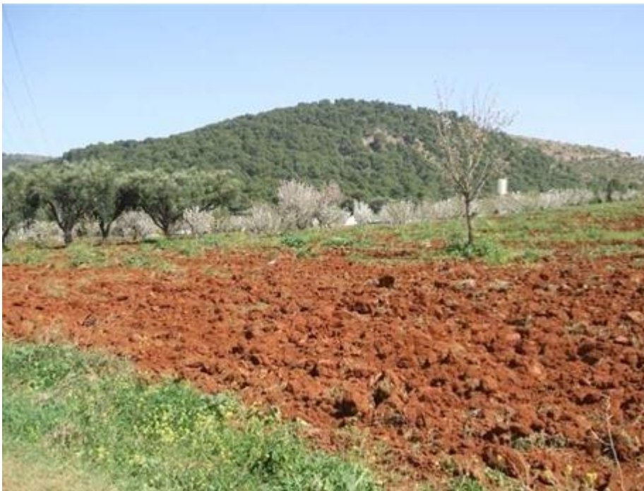
Photo 4. Interface forêt -Terrain agricole

population posent un problème d'ordre spatial. En plus, l'absence de zones tampons nuit à l'écosystème, essentiellement à cause de l'activité de la population résidant à l'intérieur et aux alentours de la zone. La présence de la population et son développement incessant peut à terme, nuire à l'aspect récréatif de la forêt par le bruit et la pollution et probablement être un facteur de dégradation du site et de perte de sa naturalité.