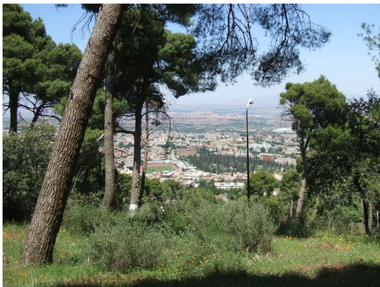
Photo 1. Vieux arbres de pin d'Alep. Au second plan, la ville de Tlemcen