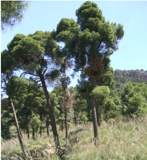
Photo. Sous peuplement vieillis. Sous-bois à base de doum et genet épineux