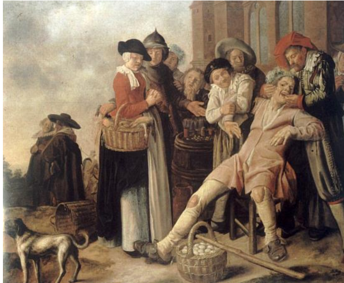
Scène populaire d'arrachage de dents

Le progrès va toujours plus avant au fil des années ; c'est en 1839 par exemple que Raspail signala, le premier, la cause parasitaire de la carie. A la suite des Anglais, Delabarre employa le caoutchouc dans la confection des appareils de prothèse ; mais c'est Nick, dentiste français, qui fabriqua à Paris, en 1854, les premiers dentistes en caoutchouc vulcanisé. L'art dentaire gagne également du terrain avec la parution du premier journal professionnel éponyme ( L'Art dentaire ) en 1857 par Préterre et Fowler notamment. C'est en 1858 que l'aluminium fut utilisé, quoiqu'on ne le fit pas encore fondre directement sur les dents.