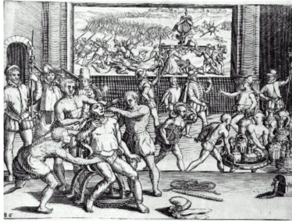
[Exécution d'Atahualpa, Las Casas, 15]