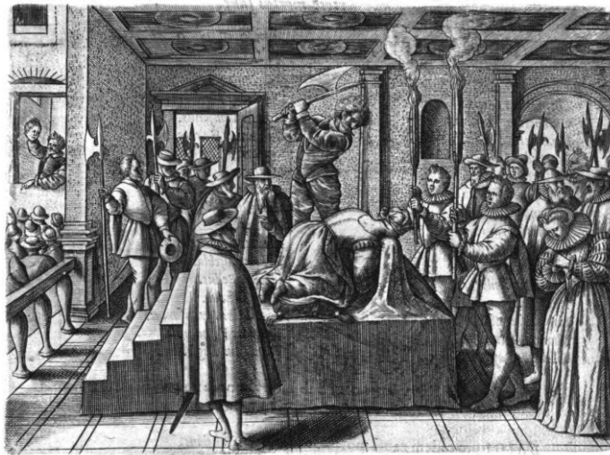
[Exécution de Mary Stuart]

texte d'autant plus précis dans la narration de l'horreur. Les illustrations concernant l'Angleterre peuvent être perçues comme une revanche pour l'auteur qui a dû fuir ce pays 36 . Une planche représente, par exemple, la décapitation du chancelier sous le règne de Henry VIII, Thomas Morus (More), chrétien ayant refusé de suivre le monarque lors de son rejet de Rome.