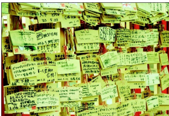
Photo 1 ▲ Vœux et prières déposés au temple sur des planchettes de bois. Temple Kiyomizu à Kyoto