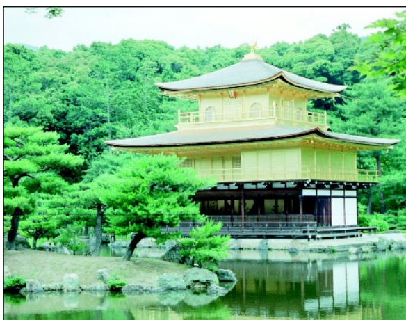
◀ Photo 3 Le temple Rokuon-ji ou Pavillon d'Or à Kyoto, un exemple d'harmonie entre les bâtiments, le jardin et la forêt du temple