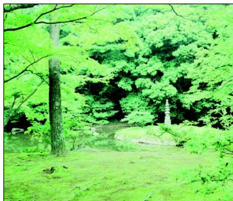
▲ Photo 5 Exemple de jardin japonais au temple Rokuon-ji ou Pavillon d'Or à Kyoto